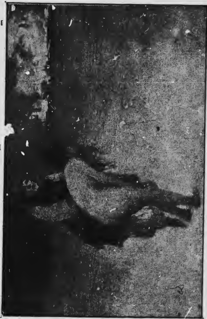
Пошкандибала стара мати Свою Марину доганяти.