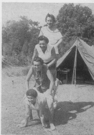
Весела гра під час дозвілля в таборі „Каліновий цвіт” в Грефтоні, Олт. серпень 1954