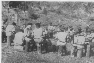
Гватемальські савати відбувають курс деревних виробів і символів