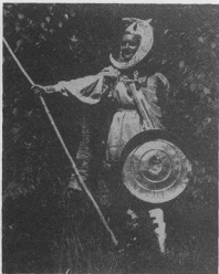
Князь - Місяць

У самім кутику скринки з оковіч, на якій сестричка Ліда писала накази, перелякано скулилася миш!