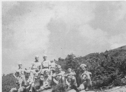
Учасники мандрівного табору УІПО — Адрондак на верхів'ї

Ми почали стверджувати, що в похованнях доісторичної і раннеісторичної доби на Україні не тільки горшки і миски, не тільки рала і жорна, але є в них і зброя — колись кам'яні сокири, кременні ножі, і стріли, потому залізні мечі, луки списи й топори.