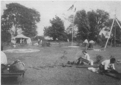
Учасниця табору „Каліновий цвіт” в Грефтон, Онт. працюють над улаштуванням табору (серпень 1954)

Повоїм же пластову присягу у наших серцях, щоб вона стала нашим „Вірую”, засадою нашого характеру, ціллю наших змагань! Тоді будемо певні, що наше життя не піде на марне і тоді сміло зможемо сказати другим: „Ходить з нами — це проста і безпечна дорога!”