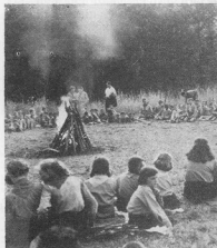
Вогник в новачковому таборі під час зустрічі з учасниками І. Дивізії в Іст Четгем, ЗДА

Це тільки вже останніми десятиліттями, після першої світової війни, після перших спроб здобути з і закрити збройною рукою українську державність — Українці спочатку трохи несміливо почали за-примічувати і стверджувати, що їх руки привикли не тільки до чепіг і