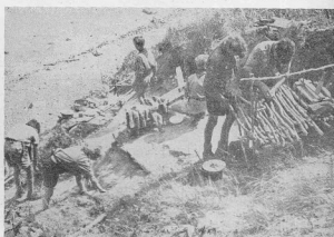
Данські савати таборують на піскових дюнах