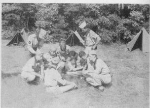
Лісові Чорти — „молода фамілія“ радять в Черчі дня 28. серпня 1954