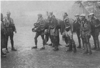
Група учасників юнацького табору в Іст Четгем перед відходом в мандрівку (серпень 1954)

Зложені пожертви на пресовий фонд допомагають нам у великій мірі видавати „Молоде Життя” й „Готуєсь” правильно і безперервно.