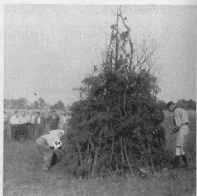
Усууси і Лісові чорти запалюють ватру з приводу 40-ліття УСР в Черчі 28. серпня 1954

Але не менш цікавим було питання, чим і як орієнтуються птахи на цих безмежних просторах? Не стану вам описувати всіх дуже складних проб і досвідів різних учених: остаточно стверджено понад всякий сумнів, що птахи напрямком свого лету наводять після стану сонця. Ну, але вночі, коли нема сонця? Для вияснення цієї загадки вжито шпаків. По різних пробах, доведено, що шапки є в спромозі врахувати рух сонця, навіть по його заході, отже мають якийсь — такби мовити — астрономічний механізм чи орган, який їм дозволяє обра-