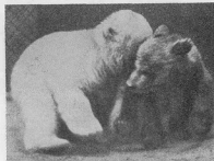
Про що вони там шепочуть...

вати. Віразу і втрома десь пропала. Тепер в нас вступило якесь нове почуття-гордість, як радше задоволення, яке людина дістає, здобувши щось гарне. Це почуття в нас ще посилювалося, коли ми вийшли на вежу, яка там стояла, і побачили ще більший простір. Краєвид був прекрасний, ми стояли довкола і не могли налюбуватися красою природи, якої ми або взагалі не бачили, або бачили дуже давно. І на вершці цієї гори кожна з нас почувалась як в іншому світі, далекому від кождоного. Сметок джусурі збудив нас з того зачохлення, і ми злізли з вежі, щоб принести риба, води і притоготовити обід. Цей обід смакував нам надзвичайно, хоча були