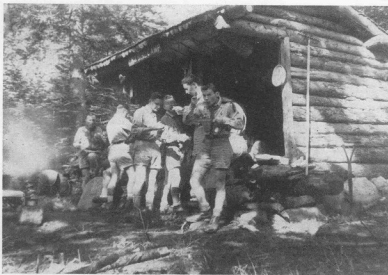
На мандрівці обід смакує (група учасників мандрівного табору УПО — Алірондак, липень 1954)

„Лубова Балка”. В таборі взяло участь ок. 30 осіб і він пройшов дуже успішно. На закінчення табору відбулася сятковна ватра, присвячена 40-літтю Українських Січових Стрільців та річницю зайняття Києва українськими арміями. У ватрі взяло участь ок. 300 громадян з Мінеаполіс й околиці.