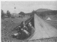
Дозвіля під шатром

Не скінчилися ці роки для нас програюю чи поразкою. Не має значення те, що нам не поведлося здійснити в той час наших мрій і бажань — здобути незалежність України. То ж у ті роки почалося велике рушення: Українці доказали собі і світові, що вони не смерди тільки, не чорнороби, не раби. Що вони нащадки вільного народу, нації, яка в минулому була передмур'ям Європи і хоче бути сьогодні господарем на вільній землі. Боями