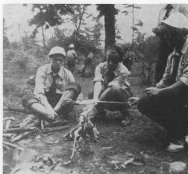
Вогник під час мандрівки учасників табору „Калиновий цвіт” в Грефтон, Онт. (Канада)

Пластова Станція в Мінеаполіс, Минн., що працює під проводом Дмитра Шогрини, зорганізувала цього року 10-денний пл. табір в околиці Мінеаполіс під назвою