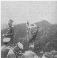
Заобуття ведшка Готік Мит (4738) учасниками Мандрівного табору Адірондак липень 1954

„Цілком просто. Було темно як на Бурлацьким Миколаю, йшли з вітром. Вліз перший і не бажуючи показати, який він нездара, затри-