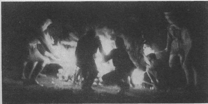
Навколо ватри у вечірнім сумерку

І стисніть дужче ваші дружні молоти долони при ватрі, щоб не прорвався через них ніхто з запаленими стрілами у сагайдаку.