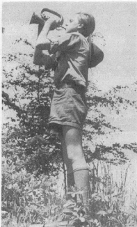
Гей, у допору!

ряться: „То що, Ви радите по лінії найменшого опору їти?“