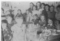
Різдвяна зустріч Пл. групи в Бостоні (10. січня 1954)

Ми належимо до Пласту, а Пласт показує нам дорогу. Він має свій