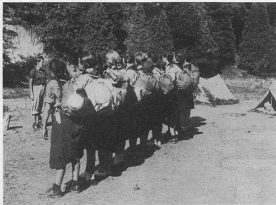
Готіві у мандрівку