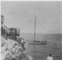
Посвячення вітрильника „Вихор“ рочестер-ської залоги морських пластуних „Бікхінг“

Іх є тільки шість, але всі здисциплиновані і діяльні члени залоги „Вікінг“. Під добрим, товариським доглядом кошового, сяюло своєї волі і підприємливості досягнути діла, яким можуть гордітися перед усіма залагами морського пластування в ЗДА. По-перше, в основу своєї діяльності в за-лозі поставили осигнення загально-пласто-вого знання і з мореплавання зокрема. Досягли ступеня пластуних гребів, що є першим ступенем морського пластування. Вони набули також на власність вітрильник, що його бачимо на знімку, і це був даль-ній вияв їхнього ділового підходу до справи. Христини цього вітрильника від-