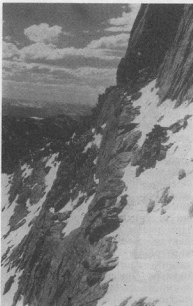
Засніжена дорога на вершок

Присівши між косодеревиною, щоб підкріпитися останньою пушкою компоту і простягнути змучені ноги, чуємо як десь в невидному ярі рівномірно шумить потік і здіймається вітер над лісом. Ніч зоряна, але безмісця, стежка губиться в снігу і до ліса прямуємо навпростець через каміння й густі вербоваті кущі. У лісі зовсім чорно — тільки над верхами сосон сіріє