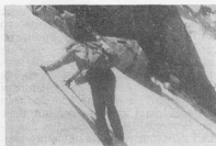
По сніговому узбіччі

„Вдруге“ прийшло за два тижні, в долині вже ціллі фіолетні ірис, на верхах блищав ще сніг, але було його вже багато менше. Прив'язавши до наплечників по парі снігових ракет власної роботи вирушаємо о 4-тій годині ранку і швидко підходимо вгору крутою стежкою через сосновий ліс. Сонце ще за деревом, вгорі просвічує синє небо, обіцяючи погоду і зрідка відзиваються птахи, (які теж вже не сплять). На висоті 10.000 футів кінчається ліс — починається косо-деревина, обчімхані поодинокі дерева простягають покручені гілляки і далі жовта трава, каміння, мохи і плахти снігу, з-під яких журчить вода. За нами, на сході, круглаві хребти у ранній мряці по другому боці долини. Перед нами блищить у сонці червоний граніт майже вертикальної стіни нашого верха, який маємо обійти з-права. Попід стіжок гори „Леді Вашингтон“ дістаємося на „камінне поле“, з якого ми завернули попереднього разу. Цим разом сніг лежить ще тільки декуди, зате сильний вітер зриває каптурі з голови, а яскраве сонце сліпить навіть через густі зелені окуляри. При розваленій колибі готуємося до другої „альпійської“ частини нашої мандрівки. Залишаємо один наплечник і наші „ракети“,