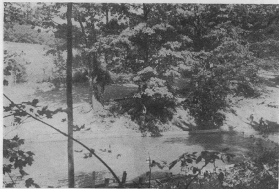
Басейн в Іст Четгем