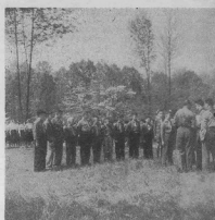
Перехід новаків до УПЮ на Святі Весни Філадельфійської Станції 2. травня 1954