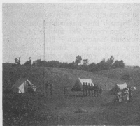
Вечірній звіт у таборі

Брати, князі Василько і Данило, що виручали себе в кожному лихові. Гетьман Подуботок, якого віри в ідею української правди не зламали царські каземати, і який в обличчі своєї смерті впевнено і гордо кинув цареві: — Нехай