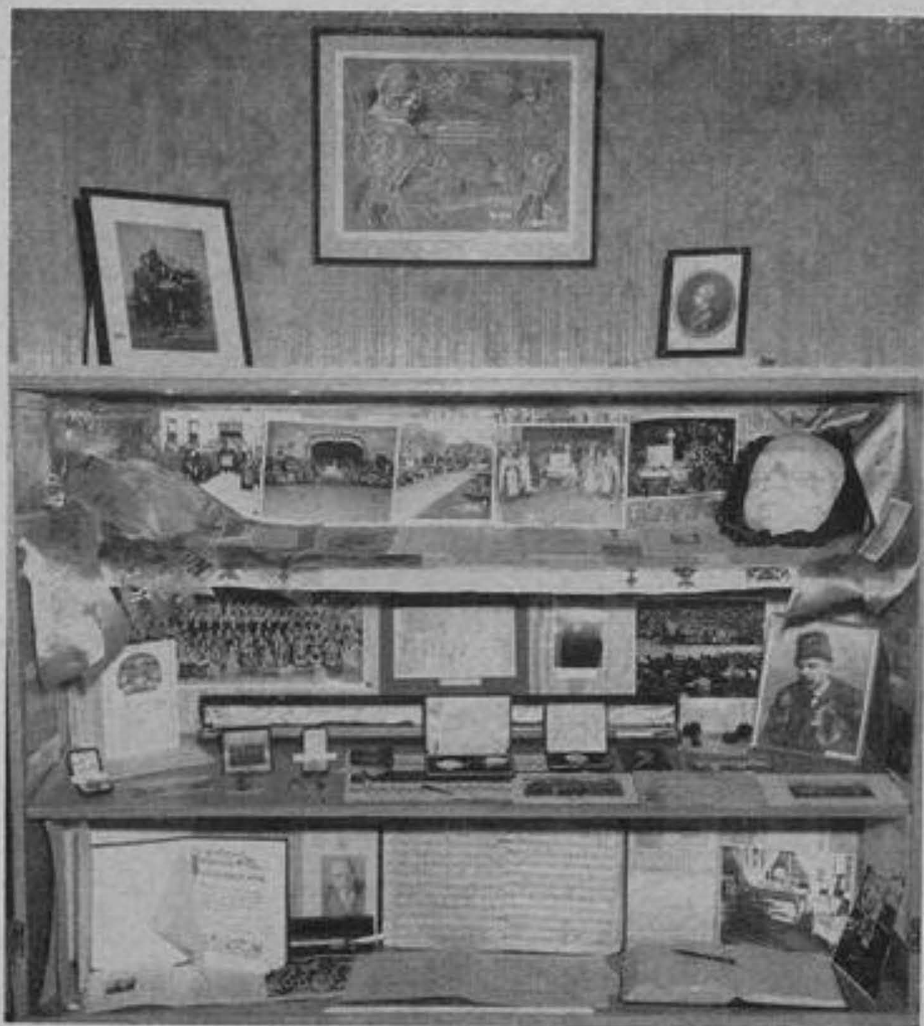
Музей — Шафа з пам'ятками музичної діяльності О. Кошиця.