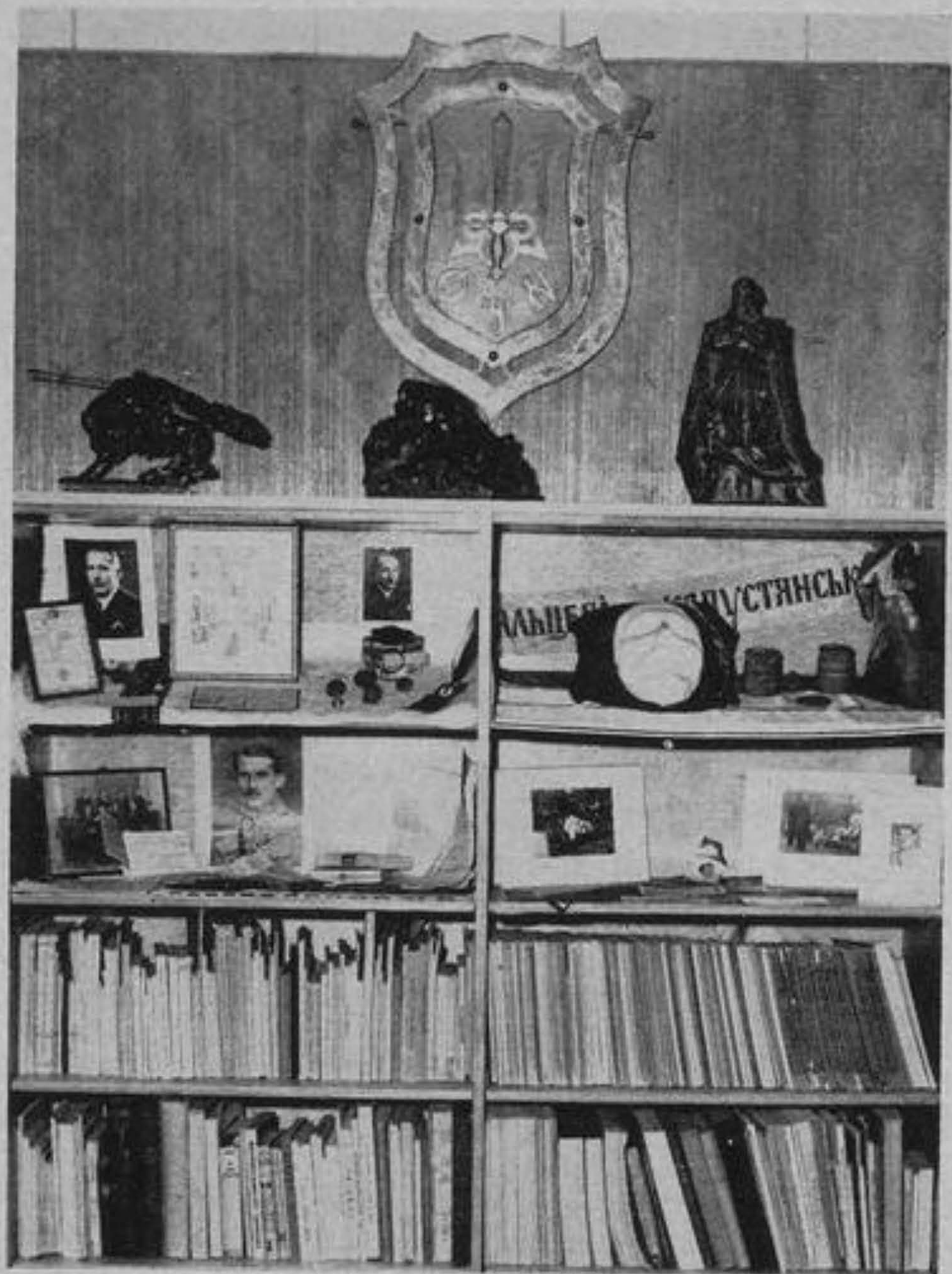
Шафа з особистими речами і бібліотекою полк. Є. Коновальця