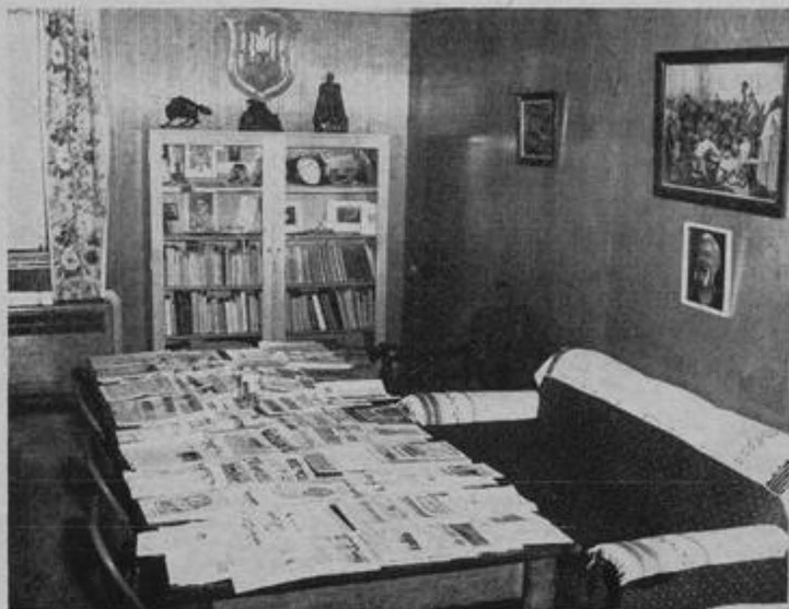
Частина Читальні Осередку

Осередок оснований в Канаді головню тому, що Канада є єдиною країною в світі, де поза межами України живе коло пів мільйона українців, головню фармерів, стало осілих на землі, збитими кольтоніями. Це фармерське населення надає ї установі більшої сталости, аніж вона моглаб мати в будьякій іншій країні, де українці в своїй масі не є пов'язані з землею і перебувають в стані постійного руху і тому більшої денационалізації. Глибока демократичність канадійських законів і суспільства, її безпека у мілітарному відношенні і толерантність до виявів різно-національних культур забезпечують Осередкові його нормальний розвиток.