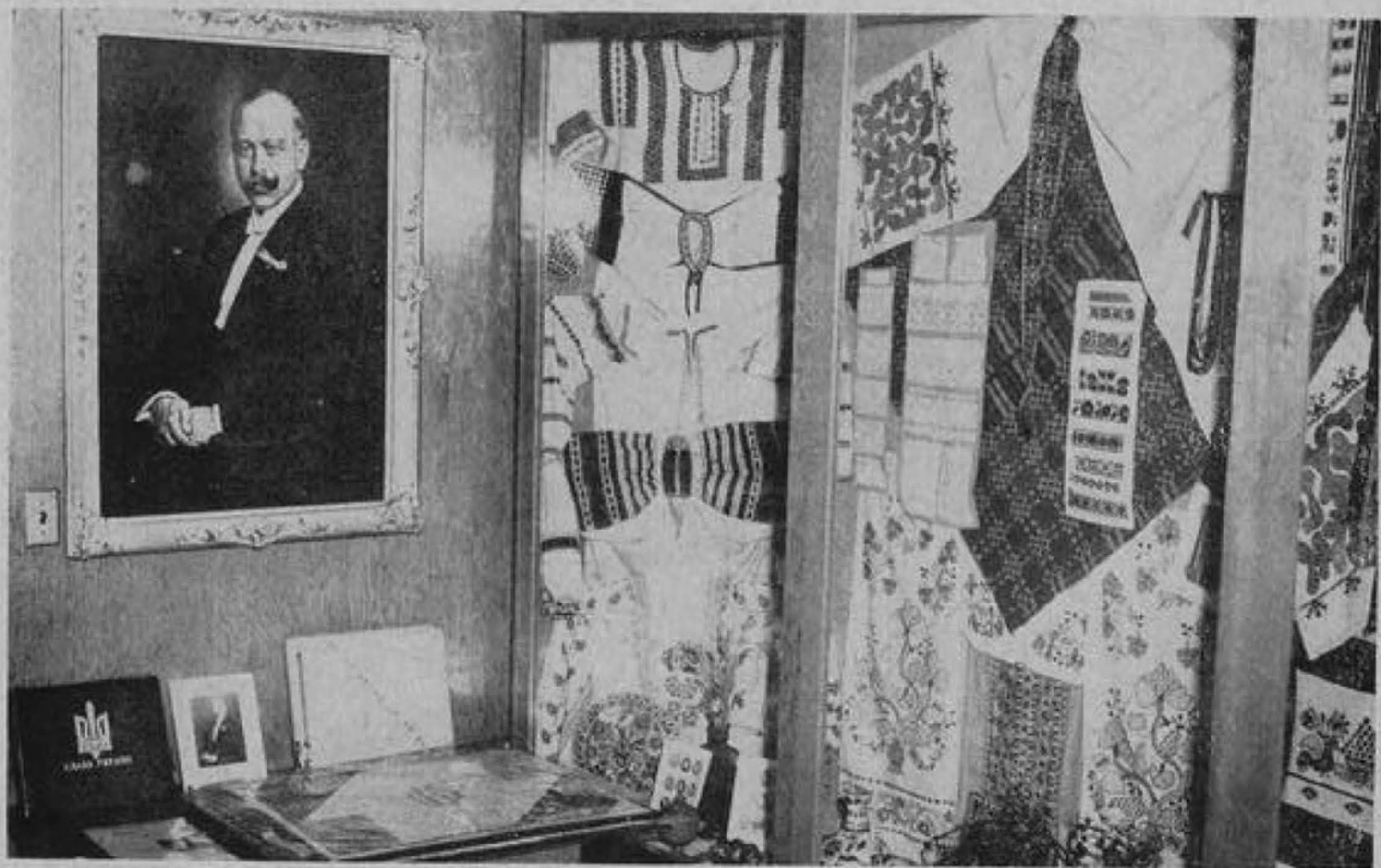
Музей — Портрет О. Кошиця з світлин 1919 р. (Олія роботи В. Кутянської 1953 р.) і перша частина шафи з народнім мистецтвом.