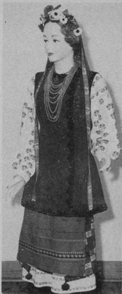
Музей — Дівчина в полтав. одязі

І найменші збірки Осередок означає іменем жертводавця!