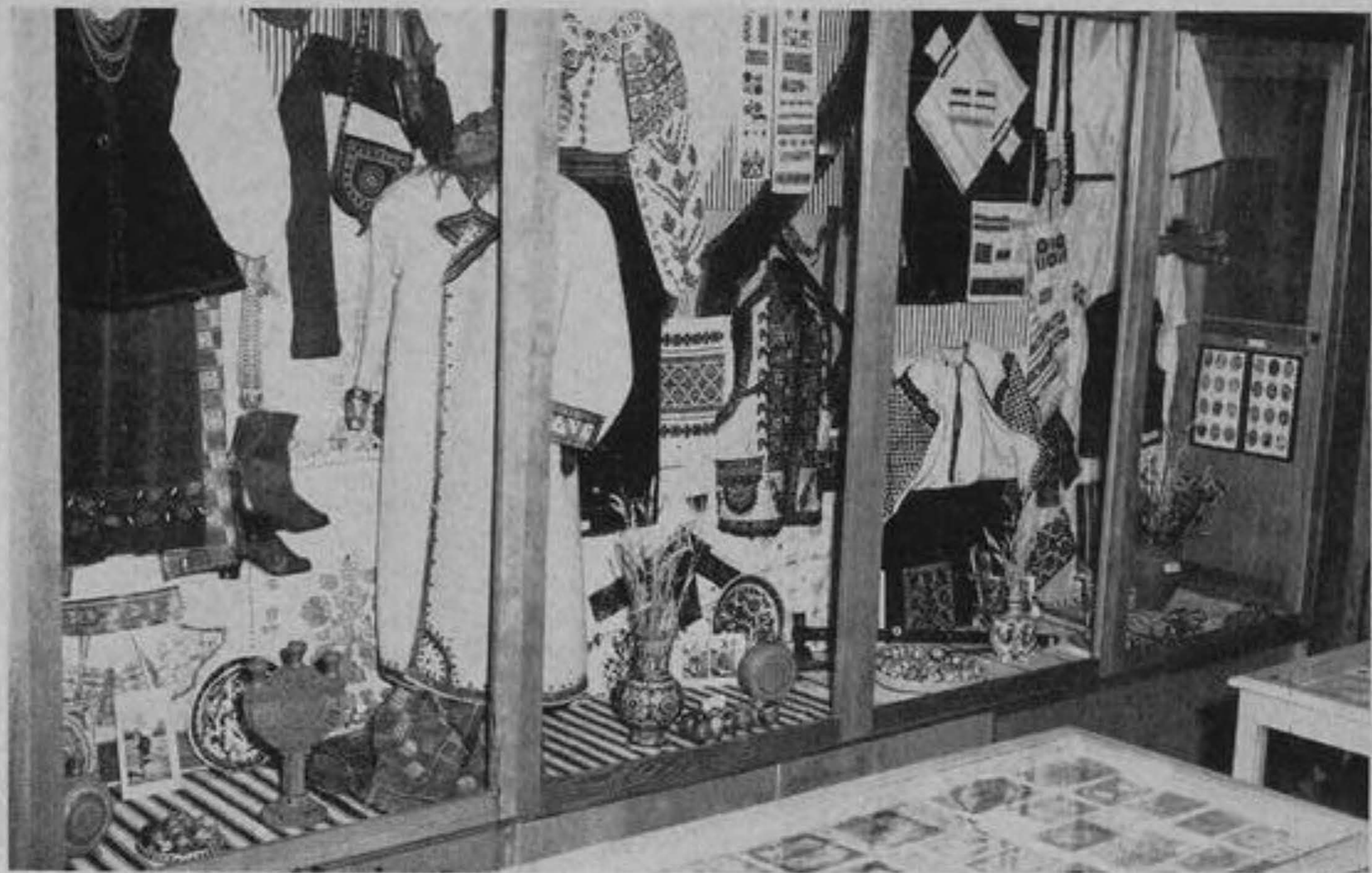
Музей — Друга частина шафи з народнім мистецтвом.