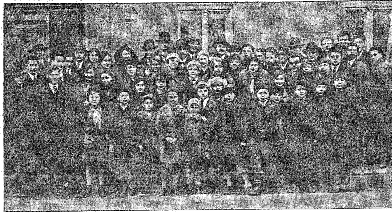
УЧАСНИКИ Й ГОСТІ НА ПЛАСТОВОМУ РАНКУ ГУРТКА «ЧЕРВОНА КАЛИНА» 19. II. 1933. В РЖЕВНИЦЯХ. Світлиця проф. В. Січинський.