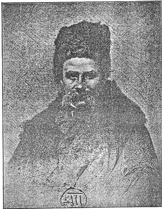
... «ЗА УКРАЇНУ ЙОГО ЗАМУЧИЛИ КОЛИСЬ».