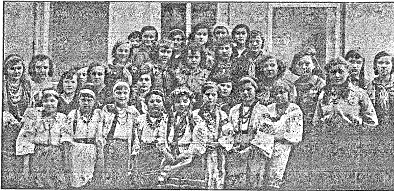
КУРИНЬ ІМ. ЛЕСІ УКРАЇНКИ при Українській Гімназії в Ржевничах.