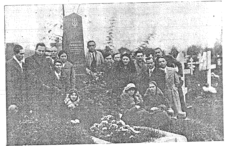
ПЛАСТУНИ НА УКРАЇНСЬКИХ МОГИЛАХ У ПРАЗІ 1. ЛИСТОПАДУ 1932. Світлиця Л. Янушевич.

5. Курінь Ст. Пл. «Бурлаки» в Брні, членів 17 (6 розвідників, 9 учасників і 2 прихильники). Курінь відбув 2 сходи і Куріньну Радю для 18. II. 1933. На програму Ради були між иншим: інформаційний реферат в чеській мові для гостей-чужинців «Розвій Укр. Пласту й його завдання», біжучі справи (джемборі, стрічі й зв'язки з чеськими клубами), привіти делегатів чеських клубів й окружного Команданта д-ра Черного й инш. Курінь поділено на 3 гуртки, що одно-