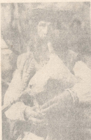
Не лише Шотландія має своїх коззарів, ось і наш гуцул - коззар.