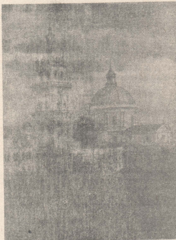
ВОЛОСЬКА ЦЕРКВА У ЛЬВОВІ.