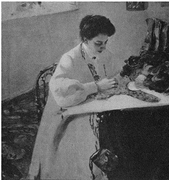
О. Мурашко. Е. Пр... за працею. 1908 р.