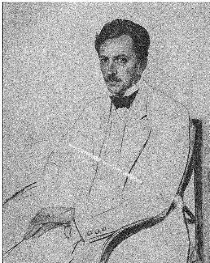
О. Мурашко. Портрет пана В. 1912 р.