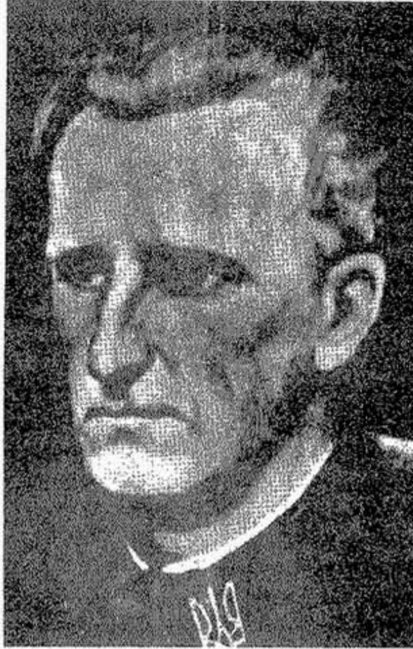
Ген. хор. Роман Шухевич - Тарас Чупринка Головний Командир Української Повстанської Армії

Кореспондент мгр. О. Луцький з Філадельфії, Па. прислав до редакції поспішною поштою повідомлення, що Головна Управа Братства Дивізійників кол. вояків 1-ої Української Дивізії Української Національної Армії на засіданні 19-ого лютого ц. р. під проводом голови д-ра Романа Дражньовського рішенням відзначити цього року Святий Рік і Рік Тараса Чупринки. Відносно Головна Управа Братства Дивізійників рішила звернутися із закликом до всіх колишніх вояків Української Дивізії та всіх українських комбатантських організацій взяти масову участь у ветеранських строях із шапками та прапорами у прощах до Риму та академіях і імпрезах у країнах поселення в пам'ять Романа Шухевича — Тараса Чупринки, ген. хор., гол. командира УПА.