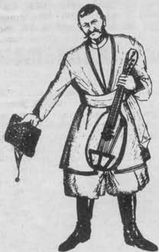
ІЗ ДИРИМ ПРИВІТОМ! КОВЗАР

(Монументальна праця про кобзарське мистецтво)