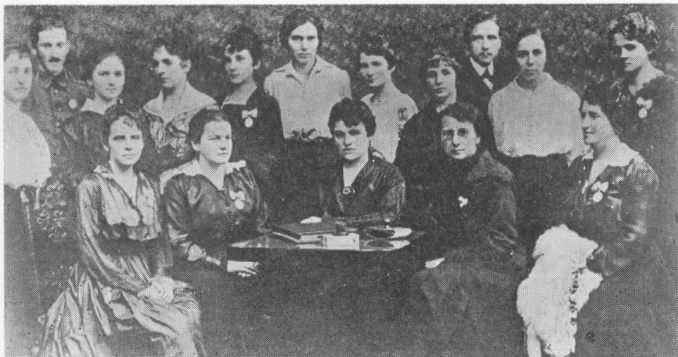
Український Жіночий Комітет Помочі Раненим Жовнірам у Відні.

По повороті на рідні землі, помимо важких матеріальних умовин, вона зразу кидається в вир громадської праці. Як член управи Союзу Українок, вона перебрала уряд скарбнички, а попри це вела теж освітню працю в