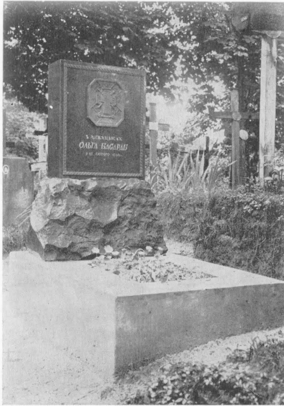
Могила Ольги Басараб у Львові, на Янівському цвинтарі.

Над нею таємним гомоном неслись слова: „Я дух одвічної стихії, що зберіг тебе від татарської неволі і поставив на грані двох світів, творити нове життя”.