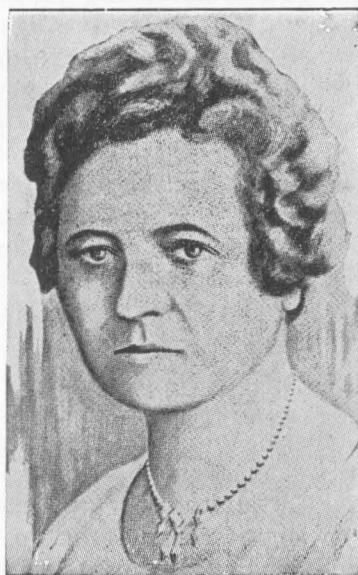
ОЛЬГА БАСАРАБ (З портрету Юрія Брика)

Кожного року в місяці лютому Організація Українок Канади відзначає святочними академіями роковини смерти своєї Патронки Ольги Басараб, яка загинула геройською смертю 1924 року за Державність України.