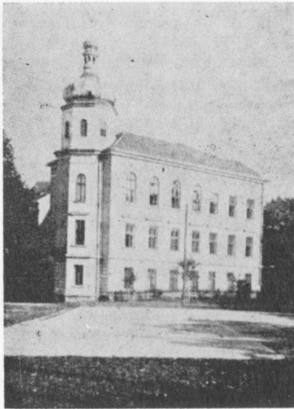
Український Інститут для Дівчат у Перемишлі (каплиця й учальні)

Написано 1950 р., друкється вперше в цілості. Поодинокі уривки поміщували журнали „Жіночий Світ”, „Наше життя” й інші українські часописи.