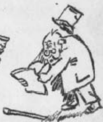
Добровольці втегли з Кавказу...