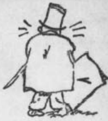
Коне нь Естонії...