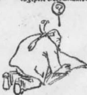
Петлюра утік до Львова...