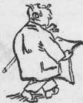
Добровольці втегли з Одеси до порту Анкерстадт...