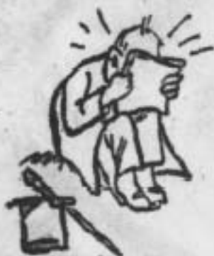
Велика подія Петлюри над Добровольцями...