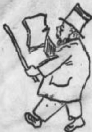
Денікіх бере Москву...