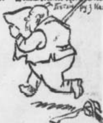
Петлюра заход Кавказу...