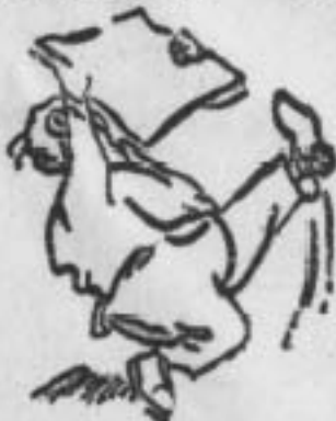
Висл. фанти одержали Котроград!...