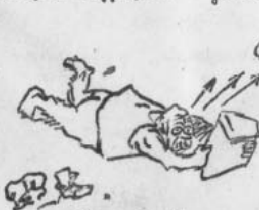
Петлюра був здохну Молда...