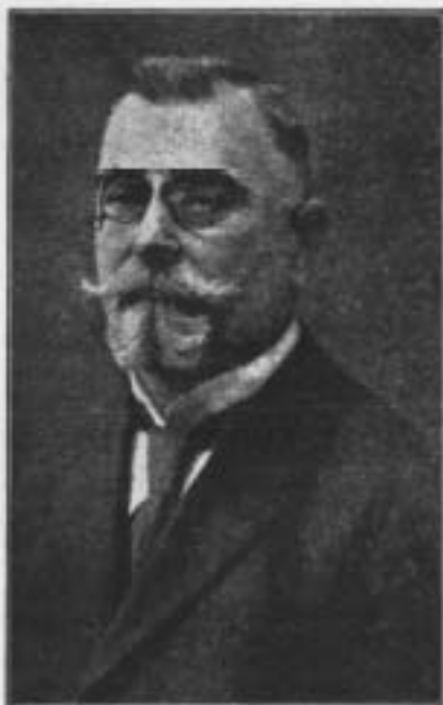
Міністер закорд. справ З. УНР. Д-р Кость Лешинський.

Кількакандить рук піднеслося і справник був зв'язаний і замкнений. Без жадного приказу уставилася сотня в два ряди і ані чигири.