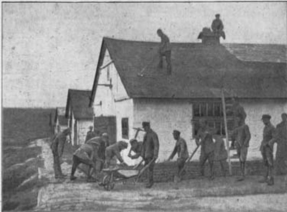
Укр. старшини накривають бараки в Укр. Таборі в Йозефові.