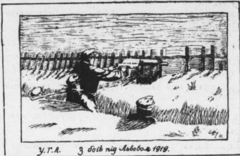
У.Г.А. 3 боїв під Львовом 1919.