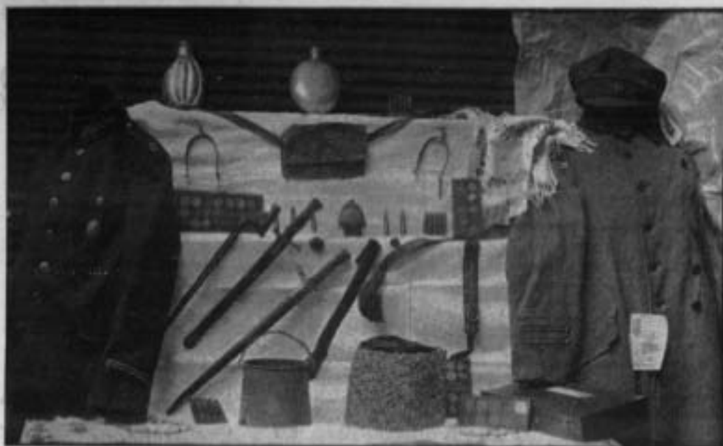
З військового відділу Музею. Уніформи, шапка полк. Вітовського, зброя, таборні гроші та ін. Світлан Л. Янушевич.