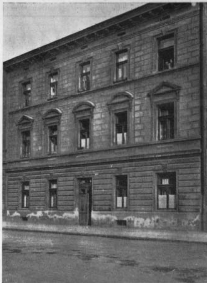
Дім Музею в Празі.

та II-му поверхах мається по 4—5 покоїв, по 2—3 кухні, комори й кловети, разом в домі є 21 покоїв різних розмірів. Дім збудовано р. 1896, але будова знаходиться в доброму стані, потребує тільки звичайного ремонту та покраски фасаду. Застраховано дім в 150.000 кор. Дім приносить — 16400 кор. валового доходу, частина якого в сумі — 4100 кор. за 2-е півріччя вже вступила до скарбниці Т-ва.