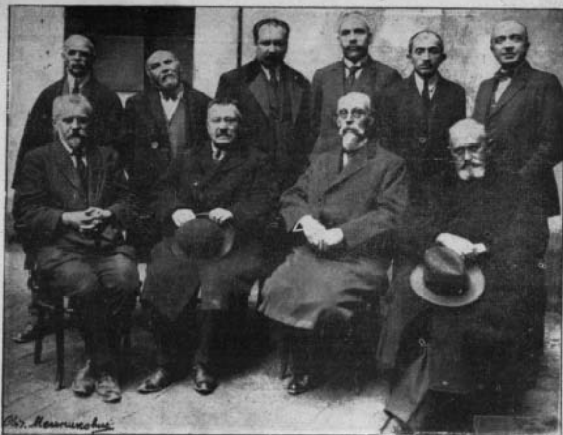
Управа та співробітники Музею.

друків, разом номерів 5. Український Педагогічний Інститут ім. Драгоманова — зразки інституційних друків, разом номерів 7. Українська Студія Пластичного Мистецтва — рисунки і фотографії, разом номерів 9. Культурно-Просвітний Кружок в Йозефові — із архиву і збірок, підраховано номерів 5643 (решта не підрахована). Т-во „Основі“ в Йозефові — образи і портрети, разом номерів 9. Українські Січові Стрільці в Празі — рисунки, малюнки і портрети, разом номерів 37. Союз журналістів і письменників — з недрукованих літературних матеріалів, разом номерів 3. Українська Академічна Громада — портрет князя Володимира, відзнака і шафа до книг, разом номерів 3. Громада Кубанців в Ч. С. Р. — власні видання, разом номерів 3. Група української національної молоді — власні видання, разом номерів 10. Видавництво української молоді — літературні і мистецькі матеріали разом номерів 20.