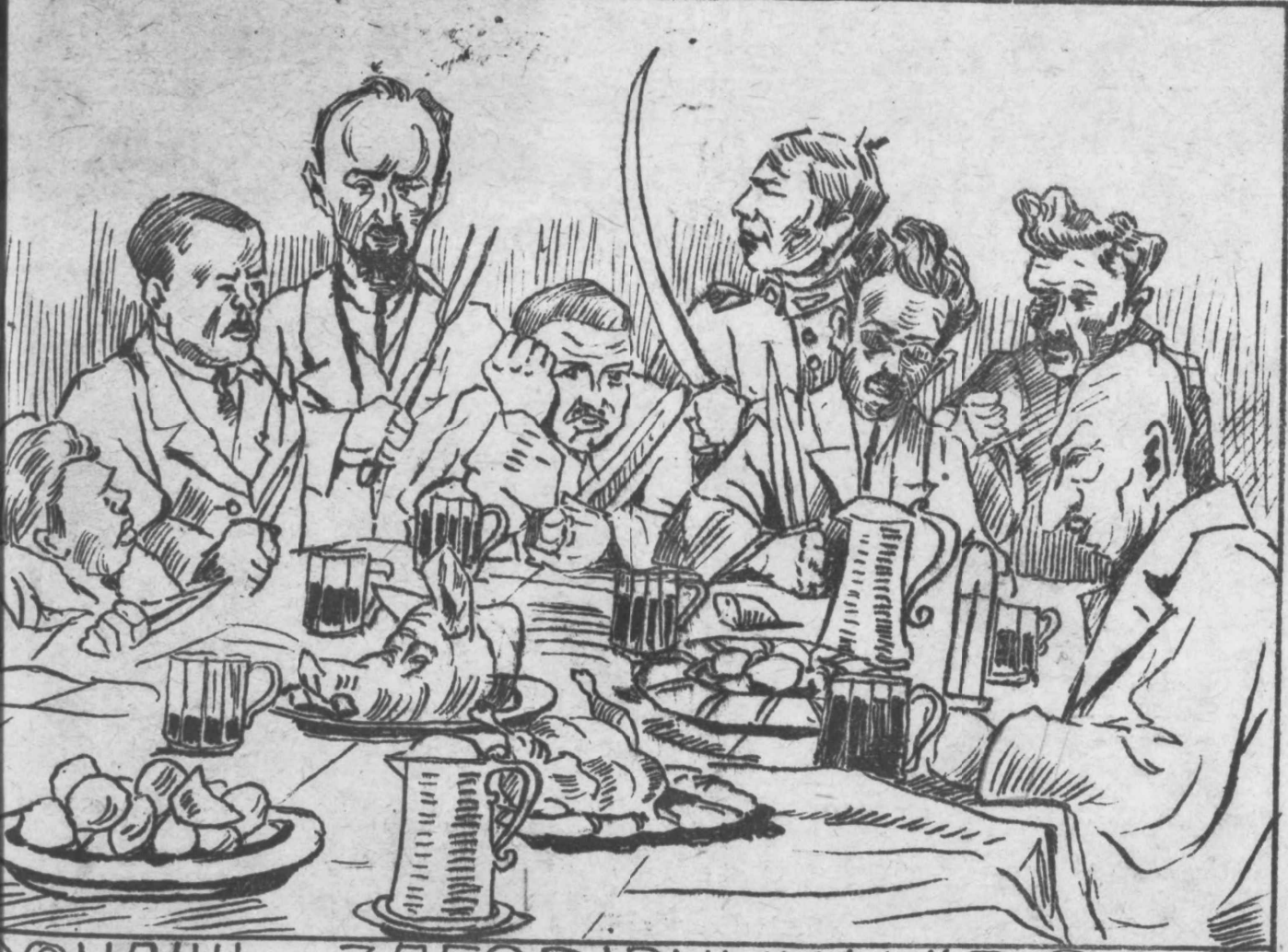
НАШИ "ЗАГОВІРНИКИ" (Our "conspirators")