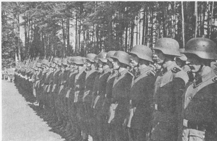
На Богослуженні у вишкільному таборі Дивізії в Гайделягрі в 1943 році. На задньому плані — український та німецький прапори.

(Передрук із Голос-Укр. Вісті (Берлін), ч. 20, 8 квітня 1945.)