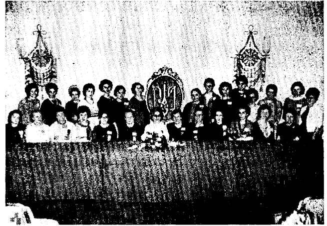
Делегатки І З'їзду ОЖ ООЧСУ

й вороги, що він піде відлунням всюди, де є українська людина. „Власні сили — це надійний і вірний шлях до перемоги”.