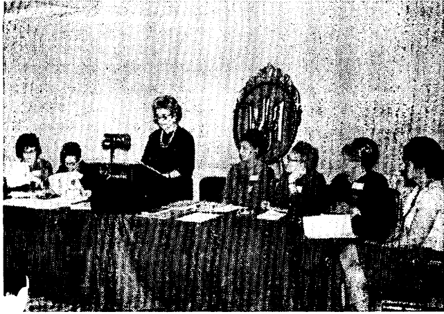
Президія І З'їзду ОЖ ООЧСУ