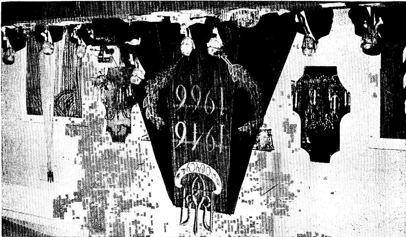
Президи ХІУ З'їзду ООЧСУ

чужинців, які підтримували б нашу справу перед урядами своїх держав. Одним з наших завдань було вчасне приєднання якнайбільшого числа прихвильців української справи — політичних діячів-антикомуністів, які розуміють, що допомога поневоленим народам є рівночасно допомогою їхнім власним країнам. А тому, що немає вже в цілому світі ні однієї країни, що не була б загрожена Москвою, число таких наших прихвильців дедалі зростає.