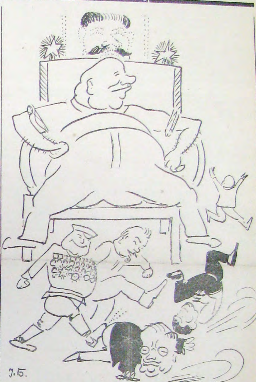
ТАК СКІНЧИЛОСЯ «КОЛЕКТИВНЕ КЕРІВНИЦТВО» СТАЛІНСЬКОЇ СІМЕЙКИ

Все можливе. Світовий потоп теж був обмежений числом сорок.