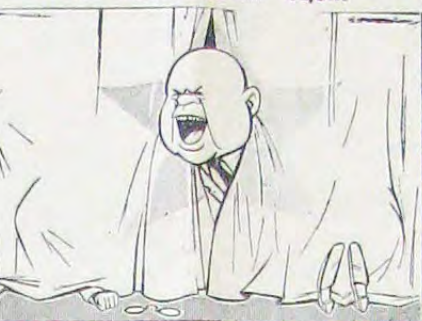
Після маленької павзи, оперета «Чаруючі усмішки» продовжується.