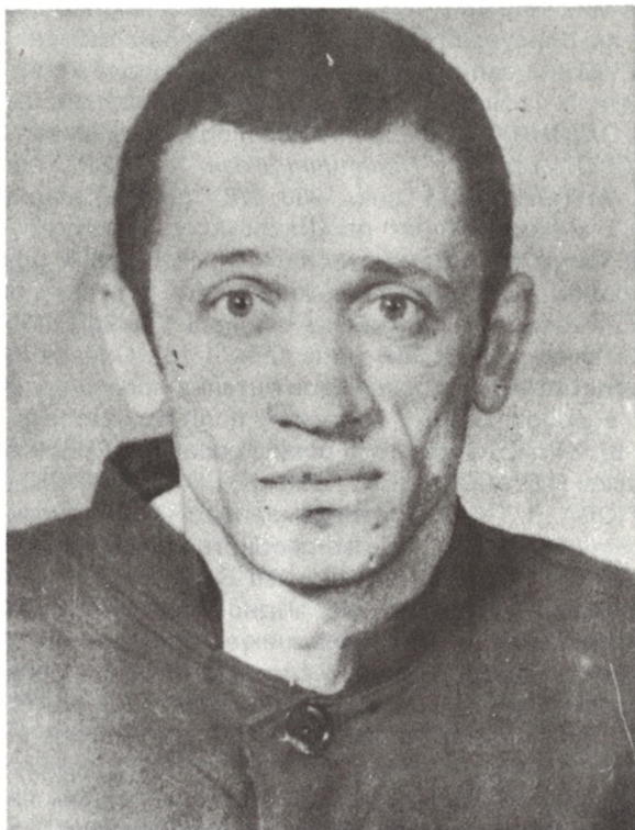
Валерій МАРЧЕНКО після першого ув'язнення (напевно, 1978 р.)

В. МАРЧЕНКА привезли на суд дуже хворим (суд навіть відклали через це з 12 на 13.III.1984 р.) У нього загострилася хвороба нирок, різко підвищився тиск (під час суду: 220/130). За свідків на суді допитували працівника КДБ при пермських таборах та представників табірної адміністрації. Крім того, кажуть допитували кількох казахів із с. Саралжин, де В. МАРЧЕНКО відбував заслання в 1979-1981 рр., у зв'язку з чим В. МАРЧЕНКО нібито зауважив після засуду, що полковник ТУРКІН (?) дістане завдяки його справі орден "Дружби народів", бо він долучив до справи звинувачення в азербайджанському, казахському та українському націоналізмах.