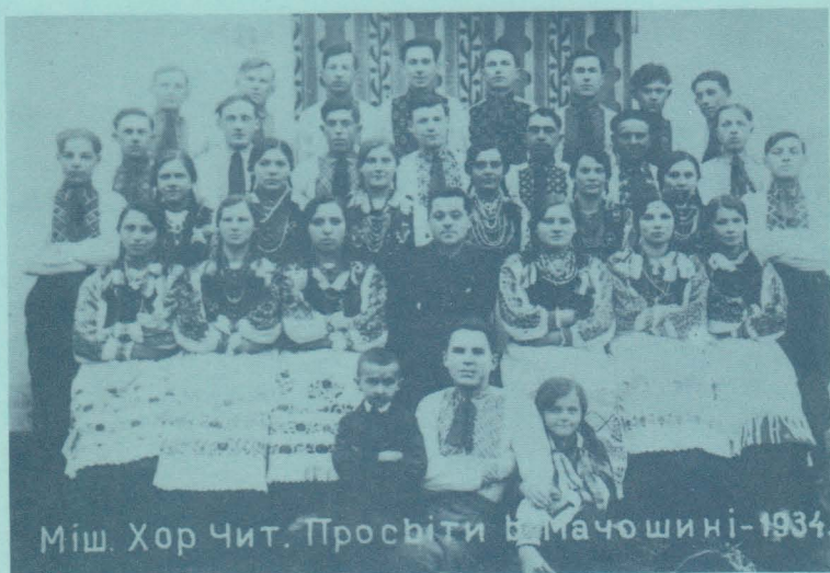
Міш. Хор Чит. Просвіти в мачошині-1934.