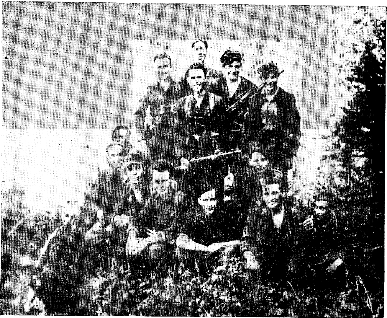
Група рейдувочої частини УПА — вересень 1947

совського від обов'язків маршала советської армії на „прохання” польського уряду. Захід не витягнув із цього факту консеквенції, хоч і в Лондоні і у Вашингтоні добачуються в цьому виразну підготовку Советів до агресивної війни.