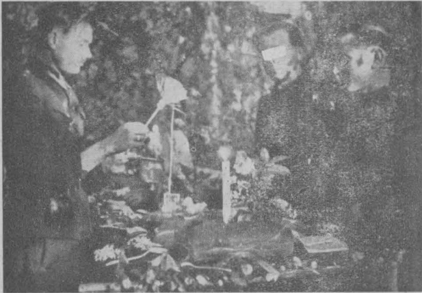
Фрагмент з Великодня 1948 р.

Зима 1946/47 була на диво спокійною. В грудні 1946 їде Володя, керівник підляшського надрайону на Грубешівщину, щоб особисто дістати вказівки про пляни проводу щодо нашої дальшої діяльності. Було зовсім ясно, що з весною наступного року треба знову числитися з якимись несподіванками, хоча договір про «виміну» населення між Польщею й УССР і вигас був 15. 6. 1946 р.; а для того були потрібні вже тепер нові напрямні. На тім місці треба сказати, що дотепер нам не все вдавалося на час дістати інструкції, коли прихо-