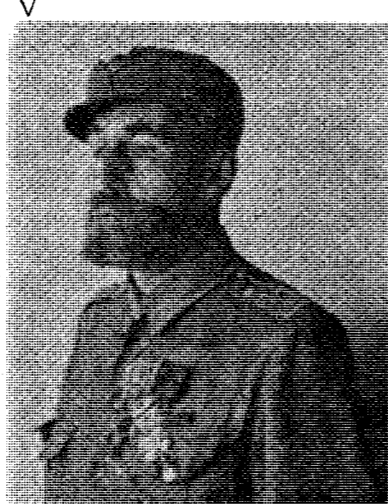
Генерал-хорунжий М. Крат