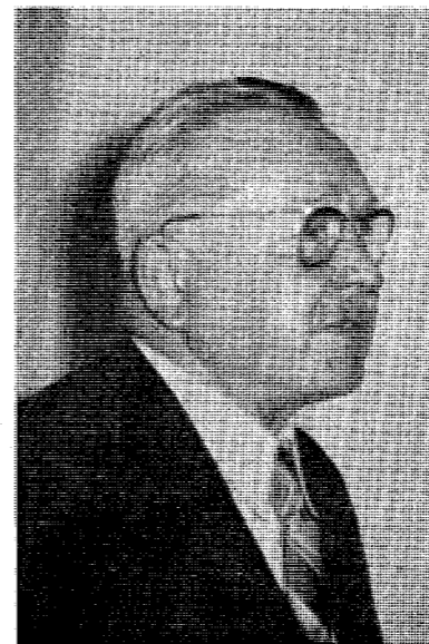
Генерал-поручник Олександр Удовиченко

Віце-президент Української Народної Республіки.