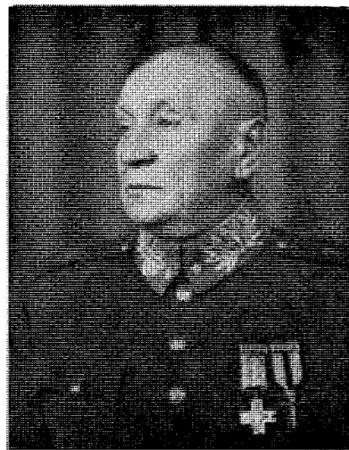
Генерал-поручник О. Загородський