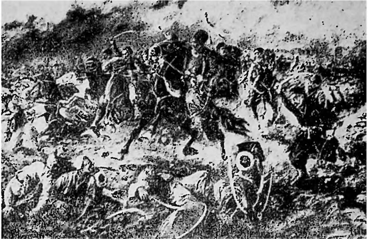
О. Климко. Гетьман Петро Конашевич Сагайдачний в битві під Хотином, в 1621 р.

Насправді хан зазнав цілковитої невдачі й боявся з'яви-