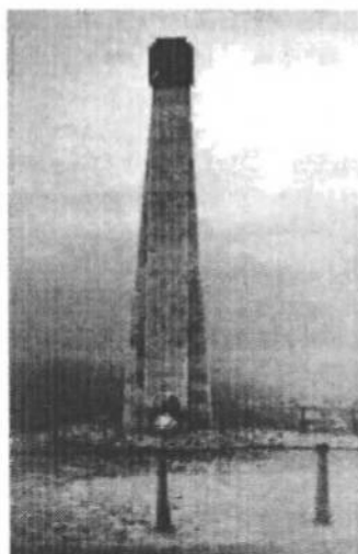
Пам'ятник воякам Української Дивізії УНА в с. Ясенові. Відслонений в травні 1991 р.