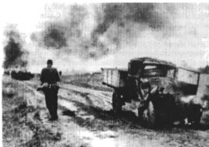
Прорив з кітла під Бродами. Липень 1944 р.

20 липня. О год. 05.00 почала наступ корпусна група „Ц”, однак із півторигодинним запізненням. Це вже ясний день. Направо ударна група досягнула добрий успіх, перейшла Буг і зайняла Белзець. В центрі перед Почапами, розгорілися затяжні бої за височину 366. Щойно вполудне корпусна група „Ц” досягнула мосту в Золочівці біля Почапів. Однак більшовики посилили атаки літаками, підтягнули резерви і ставили щораз