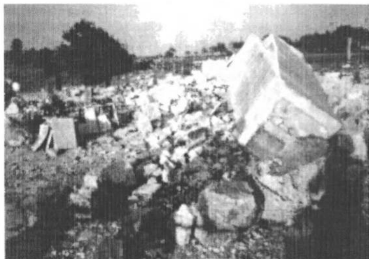
Руїна того пам'ятника висадженого в повітря в червні 1991 р.