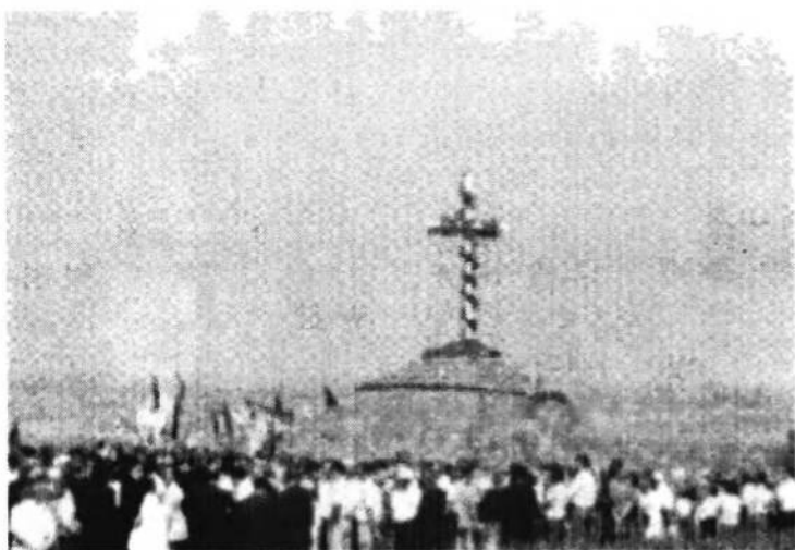
Урочисте відзначення 50-ліття боїв під Бродами на горі Жбир, 24-го липня 1994 р.

І знову, над горою Жбир лине тужлива мелодія. Стоять у зажурі люди. Їх багато. З усіх континентів землі приїхали сюди окремі посланці і цілі делегації в одностроях, які разом з численними галицькими представниками вишикувались у довгі колони і шеренги. Хоч літами не молоді, але військова виправка