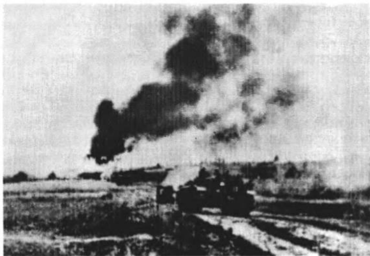
Фрагмент боїв Дивізії під Бродами. Липень 1944 р.

Командування 13-го корпусу наказало почати атаку на прорив вдосвіта 20 липня. Плян: корпусна група „Ц”, підкріплена одним курунем 361-ої дивізії та 249-ою бригадою штурмових гармат, мала перейти р. Буг в околиці Білого Камення та захопити й втримати терен між Скварявою і Хильчицями.