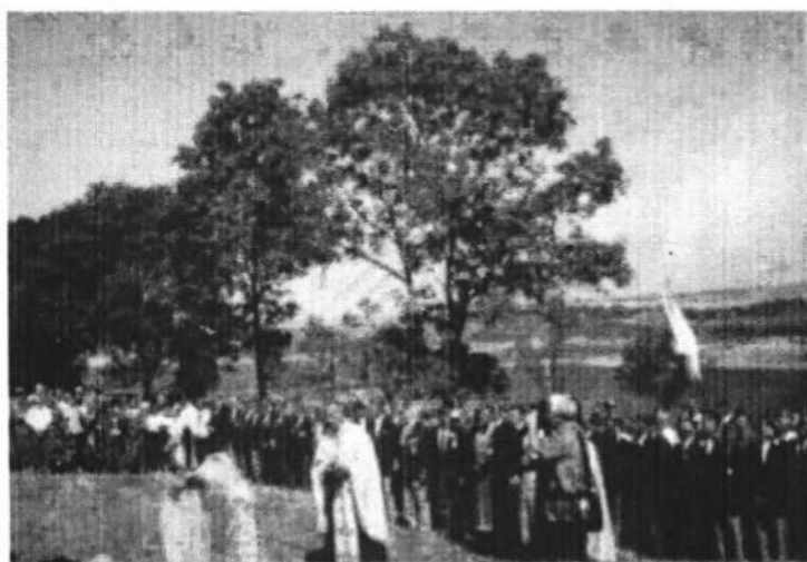
Посв'ячення пам'ятного каменя в с. Червоне (кол. Ляцьке), 23-го липня 1995 р.

В нас були б найкращі вражіння із цих відвідин міста Бродів, якщо б в неділю вранці, перед від'їздом до Ясенова, не появилися на мурах міста образливі для дивізійників написи: „Геть фашистів з України!”.