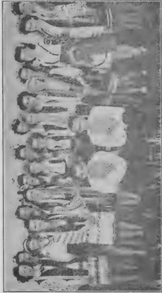
Контест танків на о́кружнім зїзді СУМК в Іст Селкірк, Ман. Контестанти з відділів у Транскона, Вініпег, Іст Селкірк і Паплар Парк. Зїзд відбувся на 1-го липня, 1945.