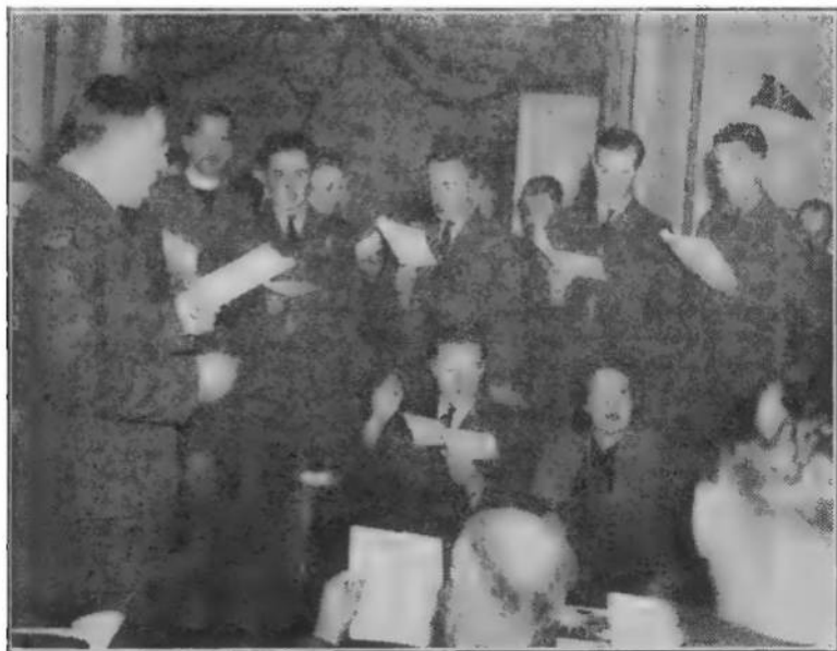
Група українських вояків в Лондоні співає колядки й інші пісні підчас Різдвяних Свят, 7 січня 1945 р. у своїй домівці.