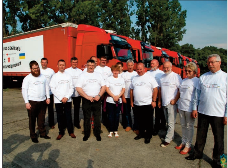
Перший заступник Президента СКУ та Речник української громади в Парламенті Угорщини Ярослав Хортяні (в центрі) серед організаторів відправки гуманітарної допомоги Україні, 2015 р., Будапешт, Угорщина

агресії, включаючи прийняття та посилення санкцій проти Російської Федерації, до захисту прав і свобод потерпаючих на нелегально окупованих територіях та до надання Україні необхідної військової, фінансової та гуманітарної допомоги.