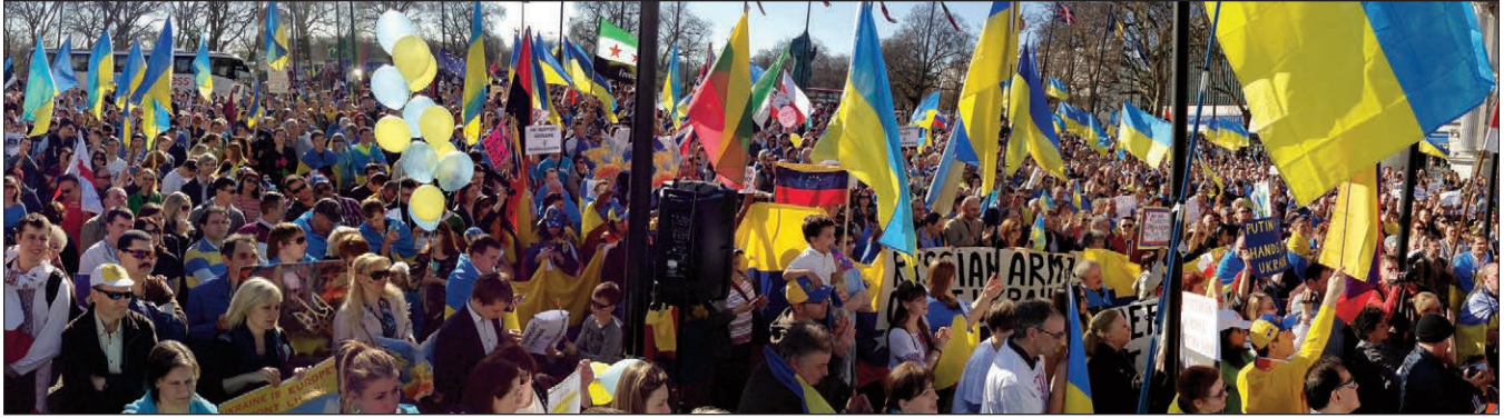
Угорі: Учасники Євромайдану в Лондоні, 2013 р., Великобританія