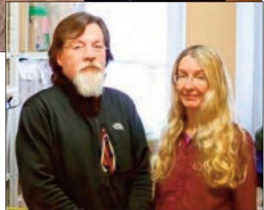
Справа: Засновники "Захисту патріотів" (зліва направо): нинішні Виконуючий обов'язки Директора "Захисту патріотів" Марко Супрун та Виконуюча обов'язки Міністра охорони здоров'я України Уляна Супрун

Станом на червень 2017 р. у рамках гуманітарної ініціативи СКУ "Захист патріотів":