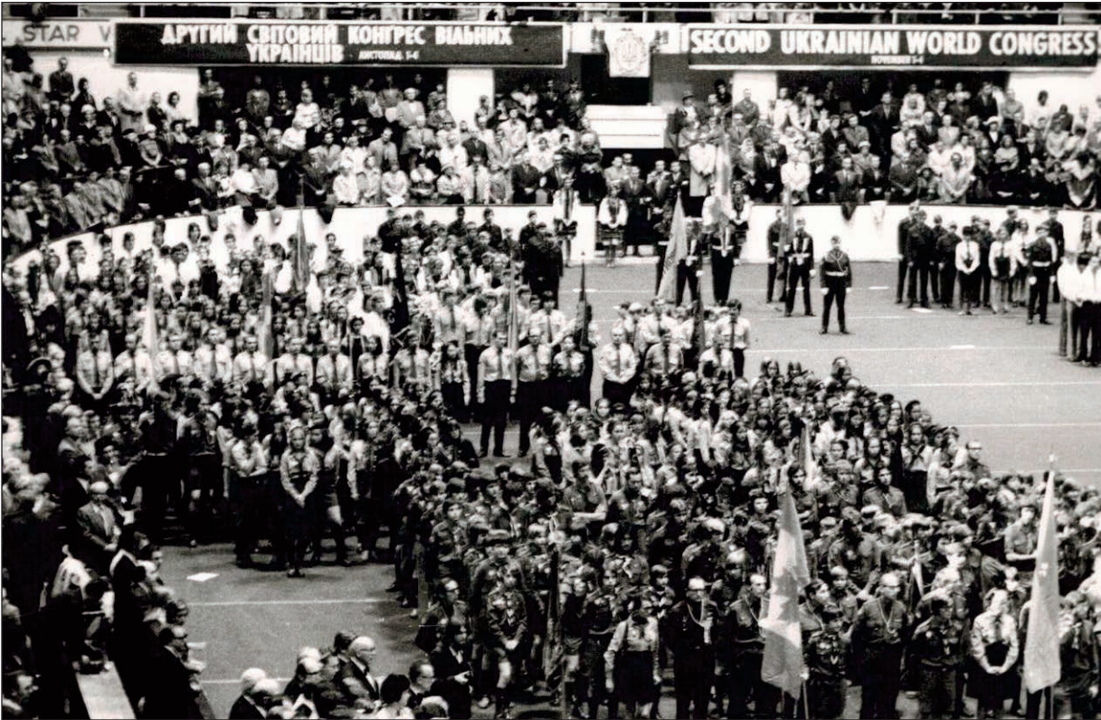
Маніфестація під час II Світового Конгресу Вільних Українців, 1973 р., Торонто, Канада