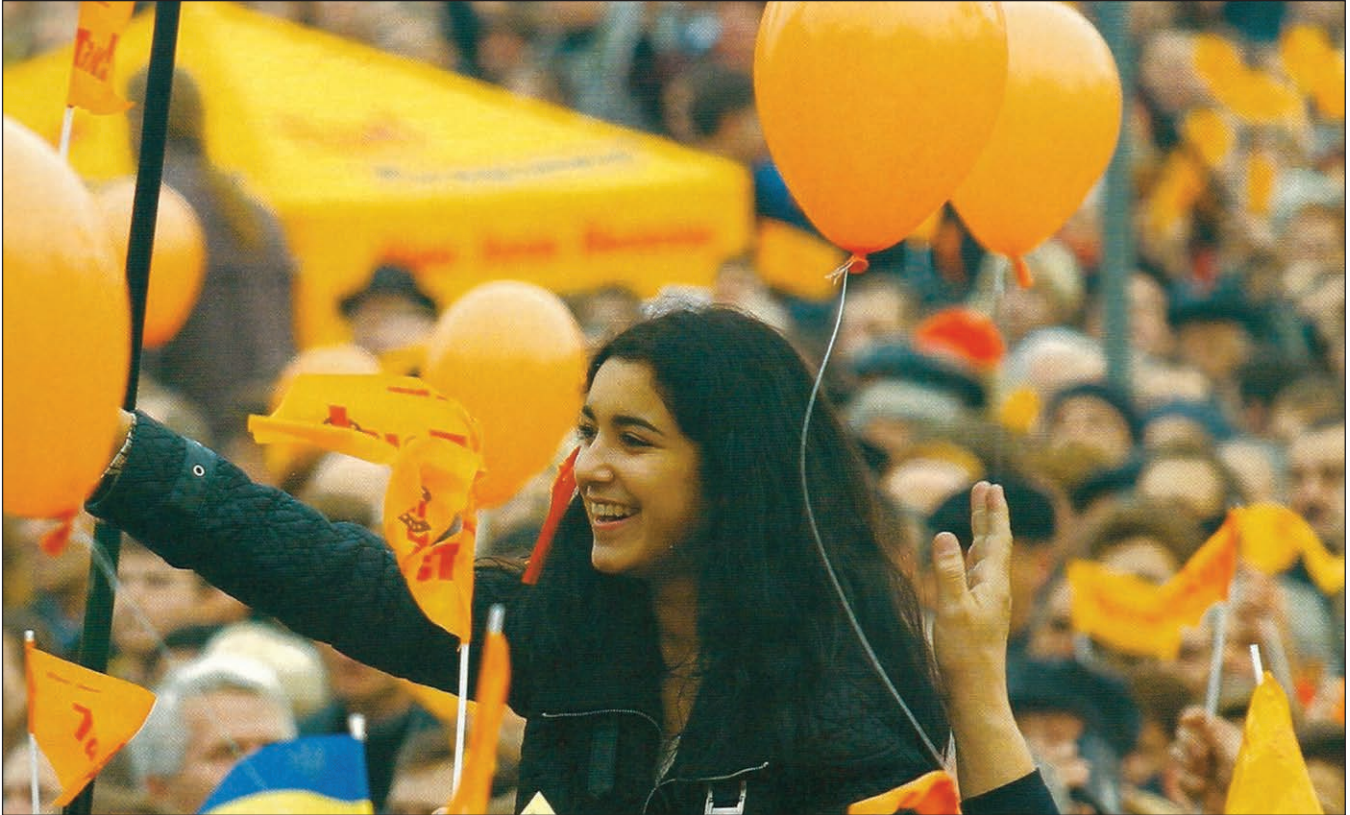
Учасники Помаранчевої революції, 2004 р., Київ, Україна

першими Українську державу визнають Польща, Канада, Угорщина, Литва і Латвія, а до кінця грудня 1991 р. – 57 держав світу.