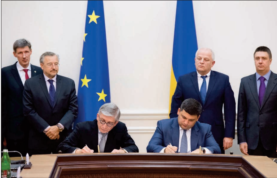
Підписання Меморандуму про співпрацю між Кабінетом Міністрів України та СКУ (зліва направо): С. Касянчук, З. Потічний, Президент СКУ Е. Чолій, Прем'єр-міністр України В. Гройсман, С. Кубів та В. Кириленко, 2016 р., Київ, Україна