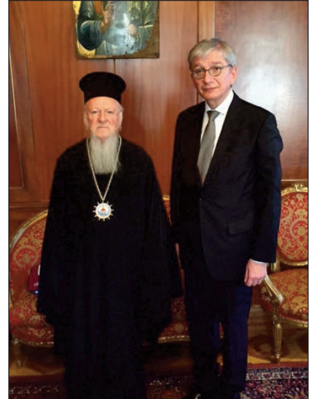
Зліва направо: Вселенський Патріарх Варфоломій I та Президент СКУ Євген Чолій, 2016 р., Стамбул, Туреччина