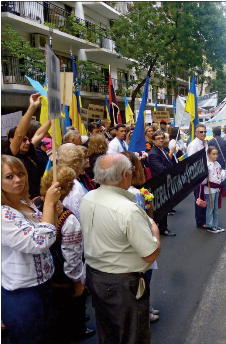
Унизу: Учасники Євромайдану в Буенос-Айресі, 2013 р., Аргентина