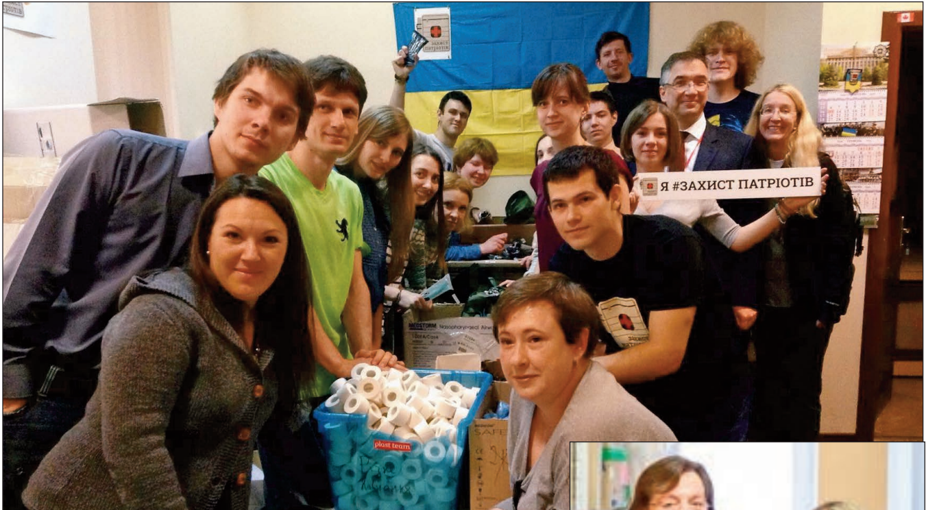
Угорі: Директор Гуманітарних ініціатив СКУ У. Супрун та Посол Канади в Україні Р. Ващук (вгорі справа) разом з добровольцями "Захисту патріотів" під час складання покращених аптечок першої допомоги, 2015 р., Київ, Україна