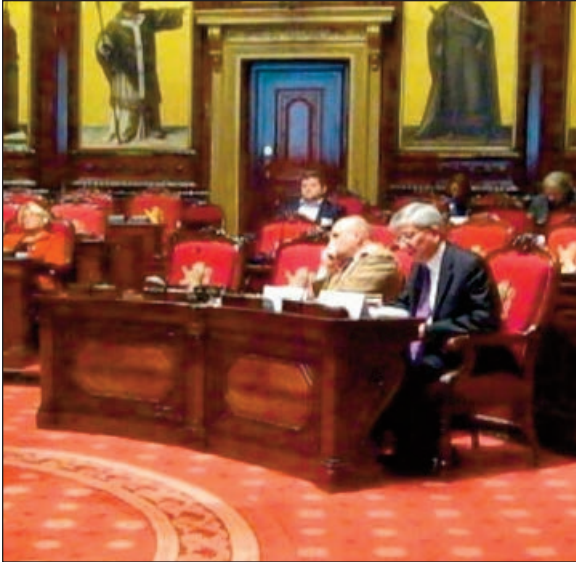
Президент СКУ Євген Чолій виступає перед Комітетом з політичних питань та демократії Парламентської асамблеї Ради Європи, 2015 р., Брюссель, Бельгія