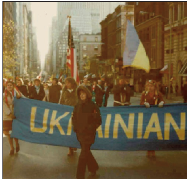
Демонстрація “В обороні прав України і поневолених Москвою народів – за деколонізацію СРСР” під час III Світового Конгресу Вільних Українців, 1978 р., Нью-Йорк, США.

СКУ проводить культурно-просвітницькі кампанії і заходи та випускає друковані матеріали, у т. ч. й: Міжнародна акція до 1000-ліття Хрещення України (1988 р.), яка інформує про історію української державності та демонструє українські національні надбання.