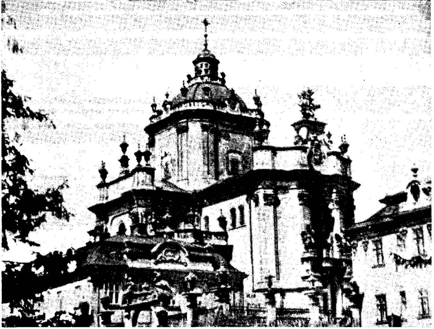
Собор Св. Юрія, Львів