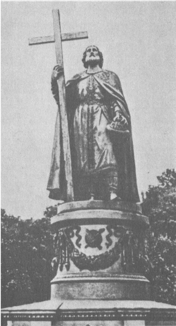
Пам'ятник Св. Володимира Великого Володаря-Христителя України в Києві