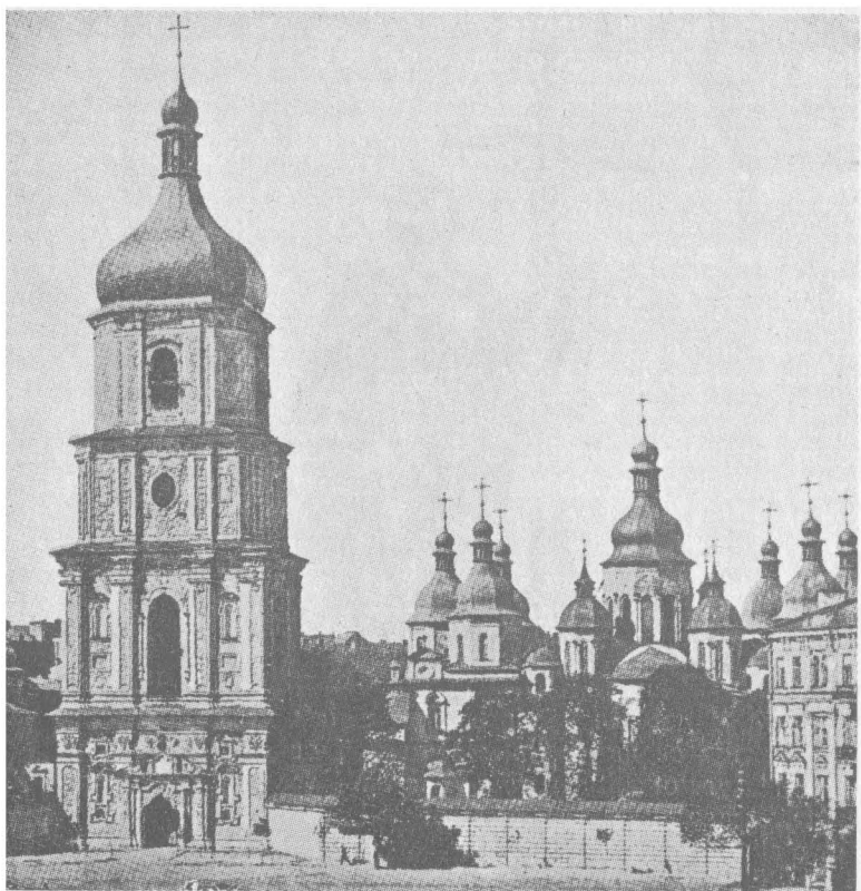
Собор Св. Софії, Київ