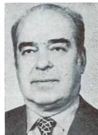
ВАСИЛЬ КИРИЛЮК 3-ій заступник президента