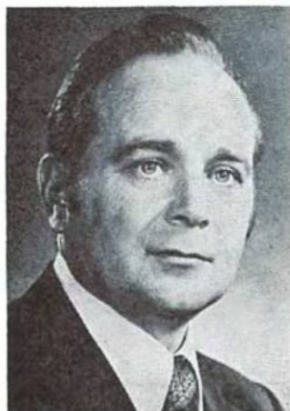
МИКОЛА ПЛАВЧУК 1-ий заступник президента