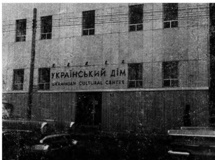
Вхідні двері до Українського Дому, вул. Крісті 83.

Праця над новим проектом розпочалася наприкінці травня 1968 р., а посвячення модерного будинку відбулося 15 лютого 1969 р. Нова споруда в'яжеться зі старою. Вона складається з великої модерної аудиторії, яка може примістити близько 1000 осіб. Аудиторія має спеціально сконструйовану модерну сцену з можливістю її поширення підлогою, зі спеціальним освітленням, куртиною і т. д. Повітряне охолодження збільшує її вартість і комфорт. Кошти цієї будови разом з влаштуваннями на сцені виносять дол. 335,000.00.