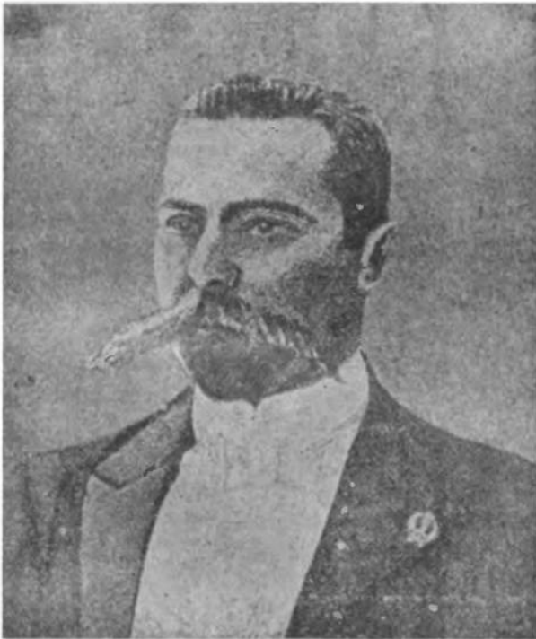
Ідеолог віпськового руху М. Міхновський.

Третього травня ц. р. минає вісімнадцять років, як у занятому большевиками Києві наложив на себе руку Микола Міхновський. Постаць — недоцінена, постать — забута. Але постаць особливо близька і цікава нам новому українському поколінню. Людина, що в час найбільшого каліцтва української політичної думки одинока відважно й отверто кидає "божевильний" на той час клич боротьби за державну самостій-