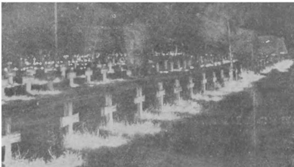
Могили Впавших Героїв — за Волю.

Вовіки славні хай будуть ці Великі Лицарі,