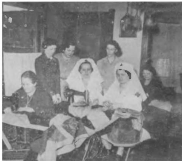
Членкині УЗХ при праці.