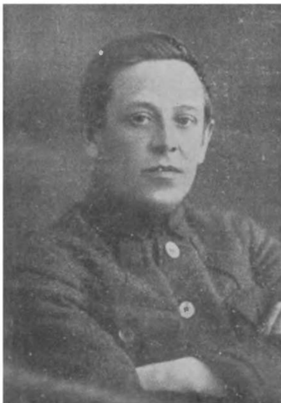
Головний Отаман С. Петлюра.

З другого боку С. Петлюра в інтуїтивній свідомості свого історичного посланництва взяв на себе всю відповідальність за Справу,