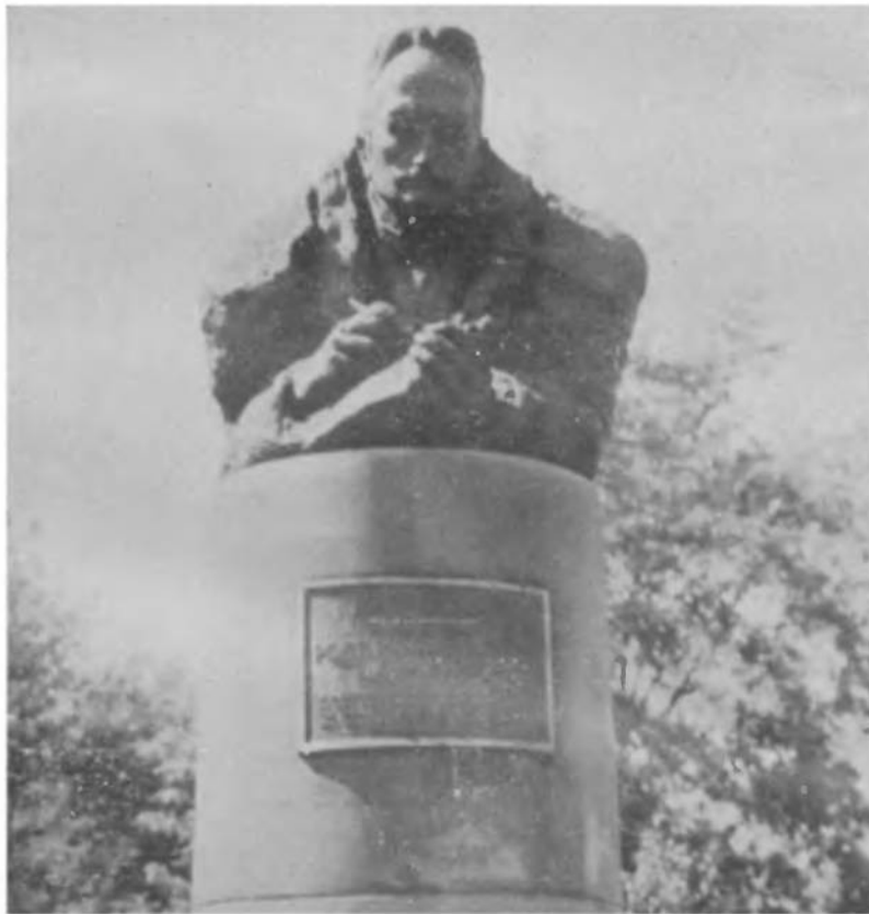
Пам'ятник І. Франка Укр. Кол. горді в Клівеленді, Огайо.

Здоровий клич пірве народ за собою до високих мет. І це щастя єдине мого життя, що бачу вже, як