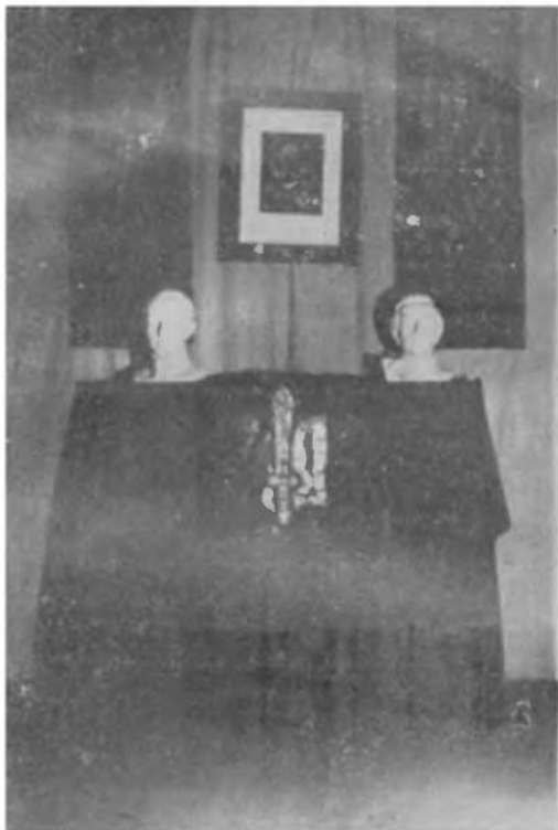
Зі свята в честь Вождів.

якої вибухи трясуть грабіжницькими владами. І гонили Тебе люті вороги по всім світі, але Ти на Твоєму шляхові ні не хитаєшся, ні не стаєш,