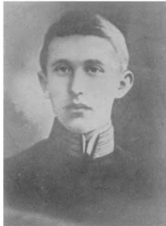
Е. Коновалець — як студент.

Во істину, Великомученику Нації: Ти й подвиг Твій всежертвенний. Ти житимеш у пам'яті Твого Українського Народу так довго, як довго ясні небеса України над рідною Тобі землею, як довго леготи шовкових блакитів України овіватимуть високі могили її героїв, і