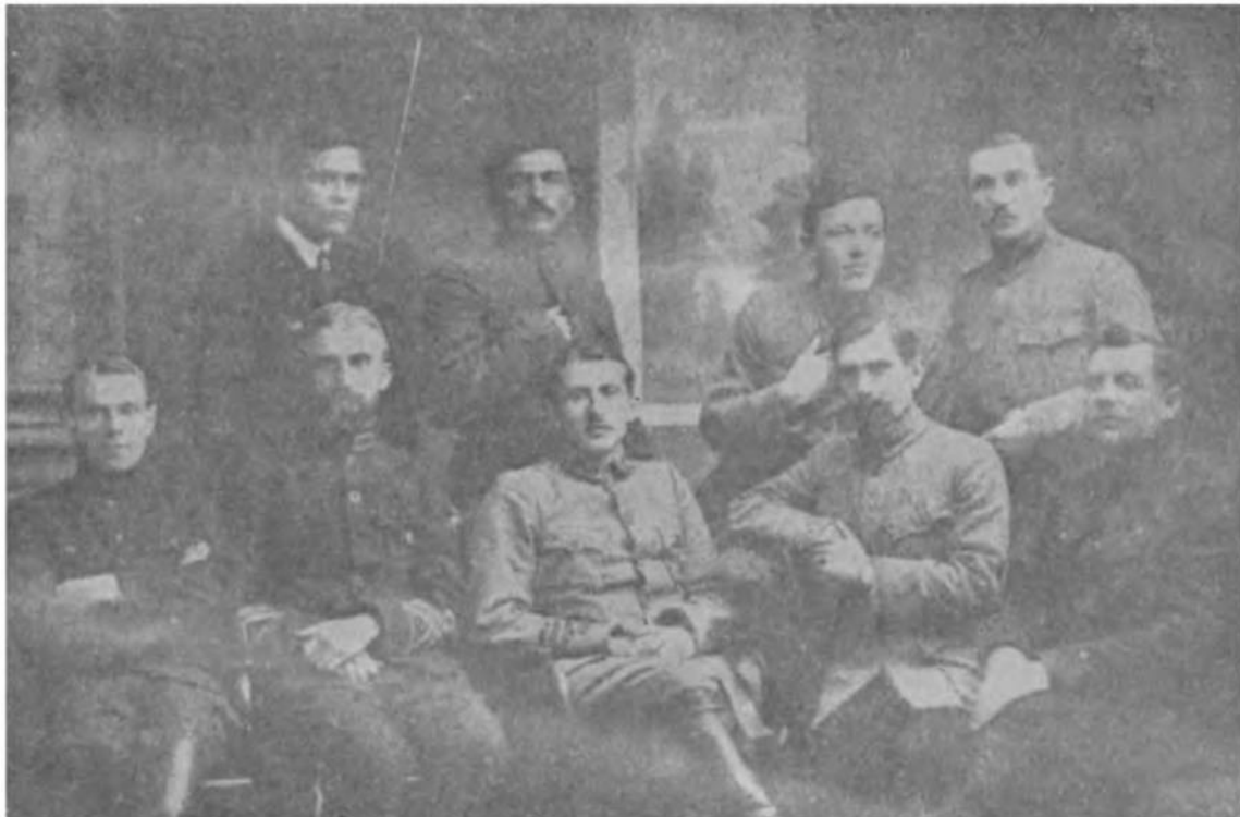
Полк. Е. Коновалець враз з штабом коша Січ. Стрільців.

абсурду: Отих Черників і Загаєвичів, Андрухів, Рогульських і підбазарських Щербаків, що здобули Київ. Що створили геройську легенду Мотовилівки, Гребінецького та Карабчіївського бою. Водночас ставали й на криваві Совети, і на ляхів, і на Денікінців, і на румунів, і на Центральні, — гей і страху не знали! А нації дають як вічне добро — новий тип українського героя: тип до одчайдушності й до жорстокости неможливого бойовика, для якого обов'язок по-ява України — це одинокий, найвищий і абсолютний закон. Щось єдине й святе, нездушиме й вічне. — “Святі якісь люди ідуть на Київ — говорили тоді, як подають очевидці. — Вони