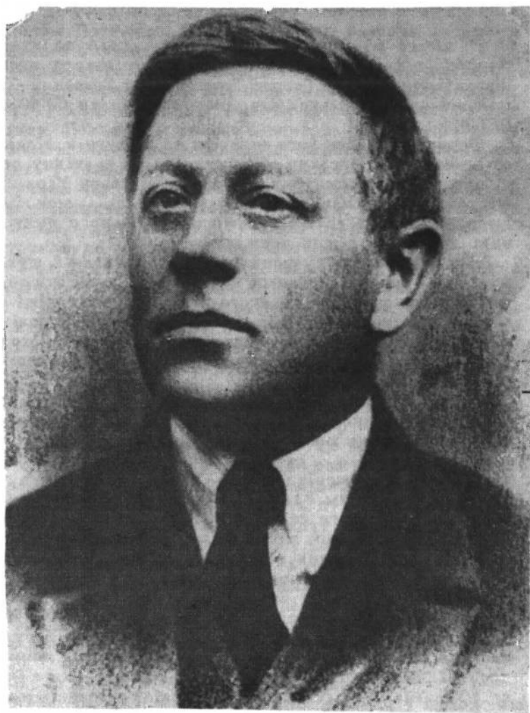
Симон В. Петлюра