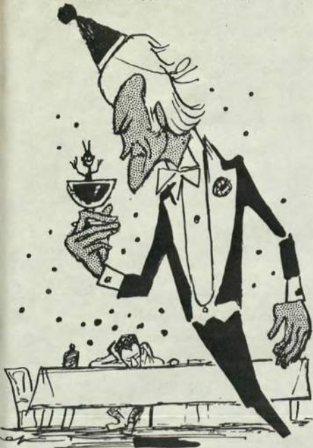
Лівцький: — Сам п'ю, сам гуляю