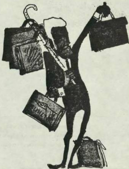
— Міністерська течка за 1000 доларів! Купуйте, люди!..