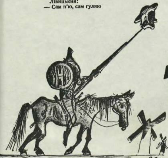
На 8-му Сесію унради в Мюнхені