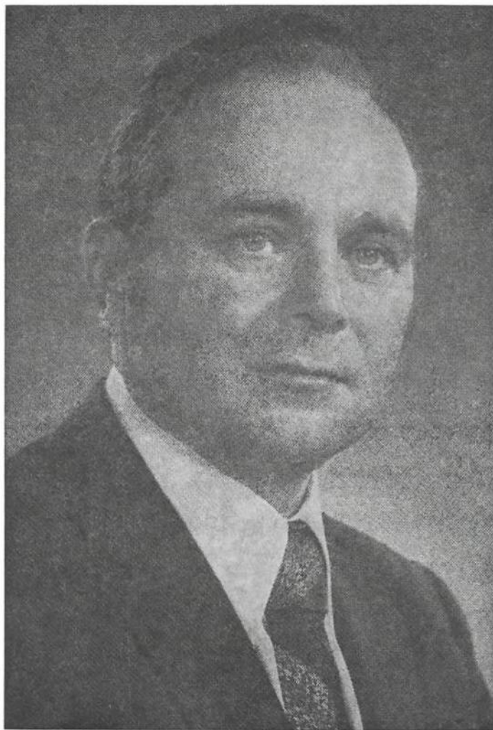
Микола ПЛАВ'ЮК Голова Проводу Українських Націоналістів