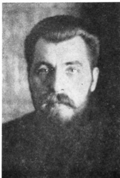
Гатиський митрополит Іосиф II Сліпий (1944—)

Сам митрополит Андрей був переконаний, що в ділі об'єднання нашої Православної Церкви, як також і інших Східніх Церков, основне