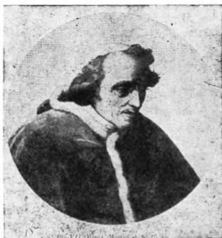
Папа Пій VII (1800—1823)

сталося з архієпископом Акеровичем після 1245 р., невідомо. По упорюючій подорожі Данила до Сараю, видно, хан домагався, щоб архієпископа Петра усунути з уваги на його участь на Соборі в Ліоні та визнання примату Римських Архієреїв. Цікавий факт, що наслідник архієпископа Петра, київський митрополит Кирило, по своєму поверті від патріярха в 1250 році мусів також визнати примат папів, бо в реєстрі митрополій патріярха Нікеї з 1256 року нема згадки про київську митрополію. Щойно по упадку латинського цїсарства в Константинополі в 1261 році, новий реєстр митрополій патріярхату вже має київську митрополію з її десятима суфраганіями. 6 Всі ці факти