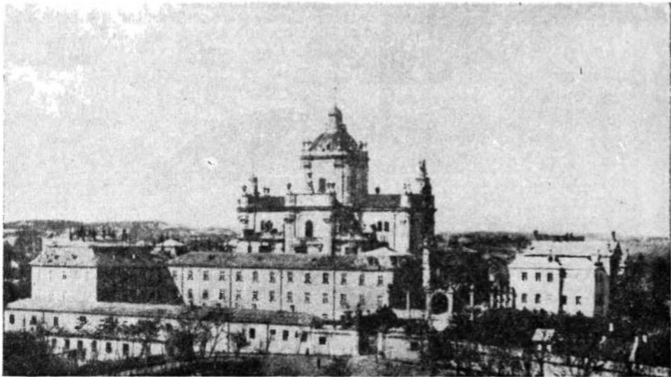
Собор св. Юра у Львові