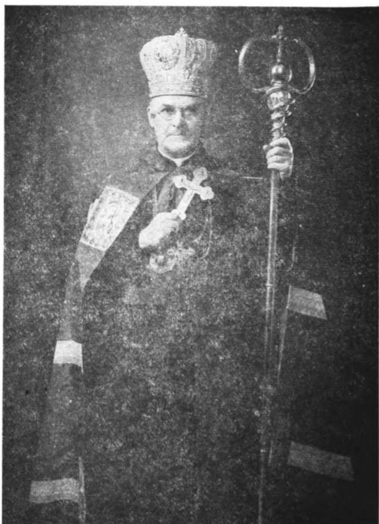
Митрополит-Архиепископ Кир Константин