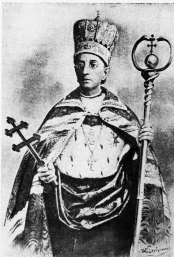
Галицький митрополит, кардинал Сильвестер Сембратович (1882—1898)

По зайнятті Львова австрійською армією 21. червня 1809 року його звільнено з тюрми. В часі короткої окупації Галичини військами Варшавського князівства багато наших священників було вивезено до Люблина під замітом, що „вони із зарядження Митрополита Ангеловича намовляли людей громити польське населення“.