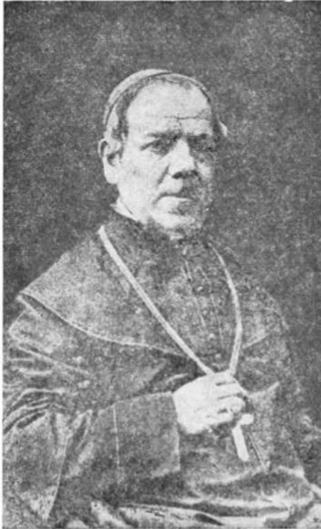
Галицький митрополит Спиридон Литвинович (1864—1869)

Не важко дошукатися „християнської логіки“ в церковній політиці Польщі, як взяти до уваги, що її король ще недавно увязнив Митрополита Ісидора і не дозволив йому переїхати через Литву до Москви, а тепер просив наvertати „схизматиків“, очевидно, на латинський обряд.