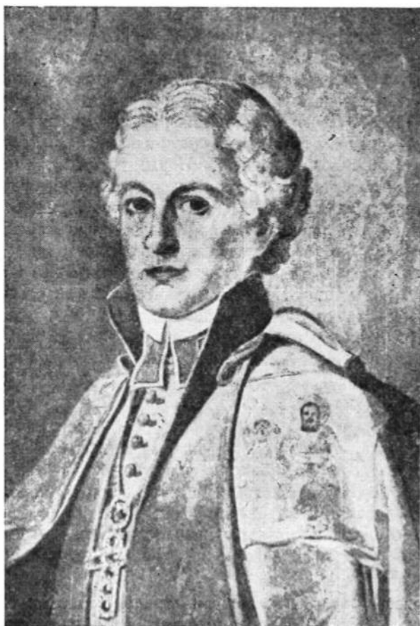
Галицький митрополит, кардинал Михайло Левиський (1816—1858)

а всі його рішення були уневажені його наслідником Ісидором (1347—1349 рр.). За „більшу пожертву“ московського князя Симеона на поправу заваленої східньої копули собору св. Софії в Константинополі, патріарх Ісидор і імператор Іван VI Кантакузен скликали Синод