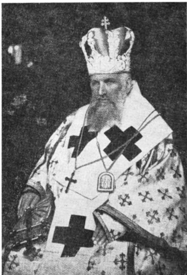
Галицький митрополит Андрей граф Шептицький, ЧСВВ (1900—1944)

Папа Лев XIII у своїй бесіді до української делегації в дні 29-го