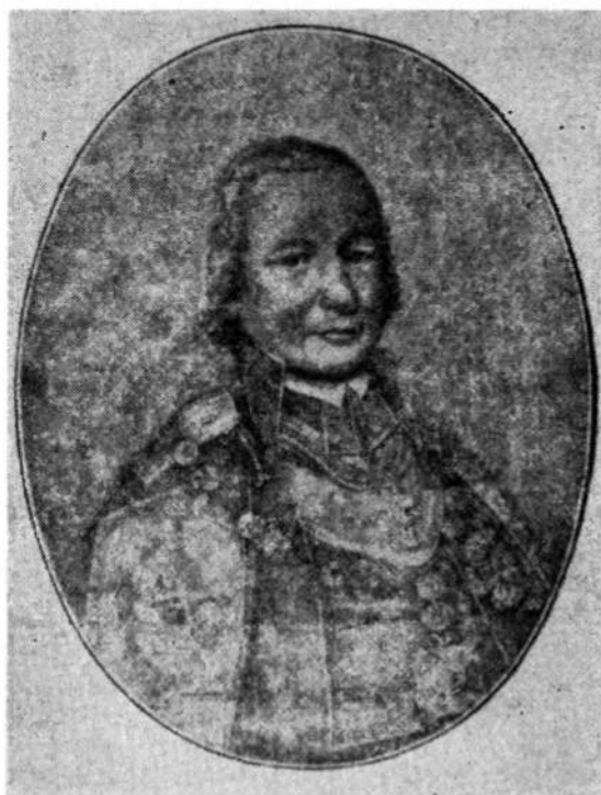
Галицький митрополит Антін Ангелович (1805 - 1814)

Митрополитові Теоностові, що виявився енергійним і рухливим, таки не вдалося підчинити собі Галицької Митрополії, бо там бачимо митрополита Гавриїла. Треба згадати, що в часах владництва митропо-