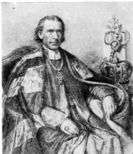
Галицький митрополит Пiosif I Сембратович (1870—1882)

Лісовського на київській митрополії, а в Римі вважали галицькі єпископства її складовою частиною. Тому імператорові було вислане відмовне письмо з такими мотивами: 1. на Русі не було двох митрополій; 2. архієпископ Лісовський уже одержав юрисдикцію для всіх східніх католиків на Русі; 3. у Львові є вже один латинський митрополит; 4. Василяни не будуть вдоволені. Це останнє, мабуть, з уваги на Ангеловича, який не був Василянцем, бо від Замойського Синоду в 1720 р. витворилася у нас практика, що кандидати на єпископів, як