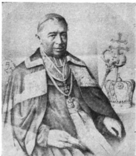
Галицький митрополит Григор барон Яхимович (1860—1863)

Не ждучи відповіді патріярха, литовський князь і польський король, Ягайло, іменував сам кандидатом для Галича луцького епис-