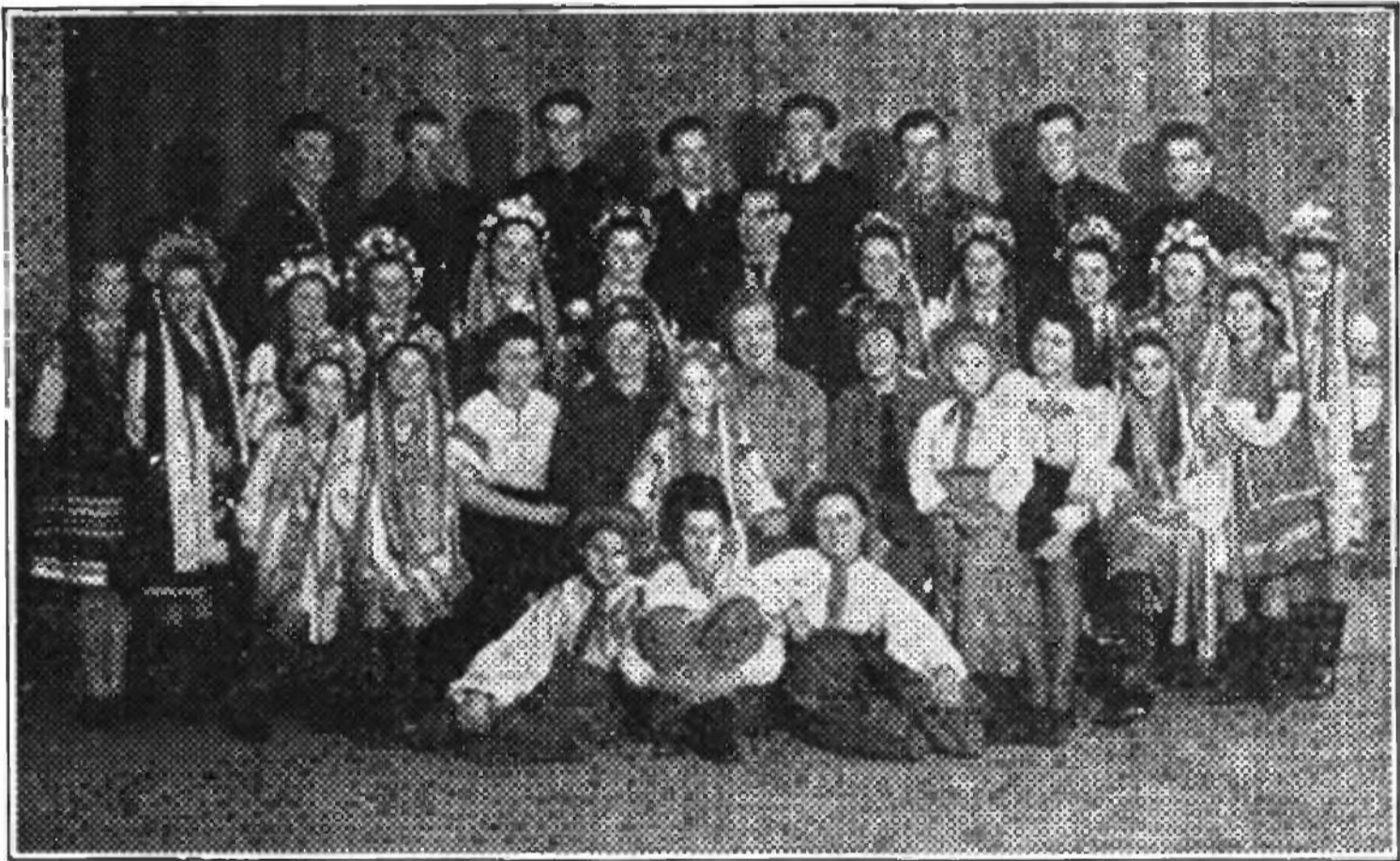
Хор українських школярів у таборі в Райнгарті (Німеччина)

Бо ми вартуємо 41 центів від особи, а Жид 21 або 22 дол.! Ось тут Вам відповідь!