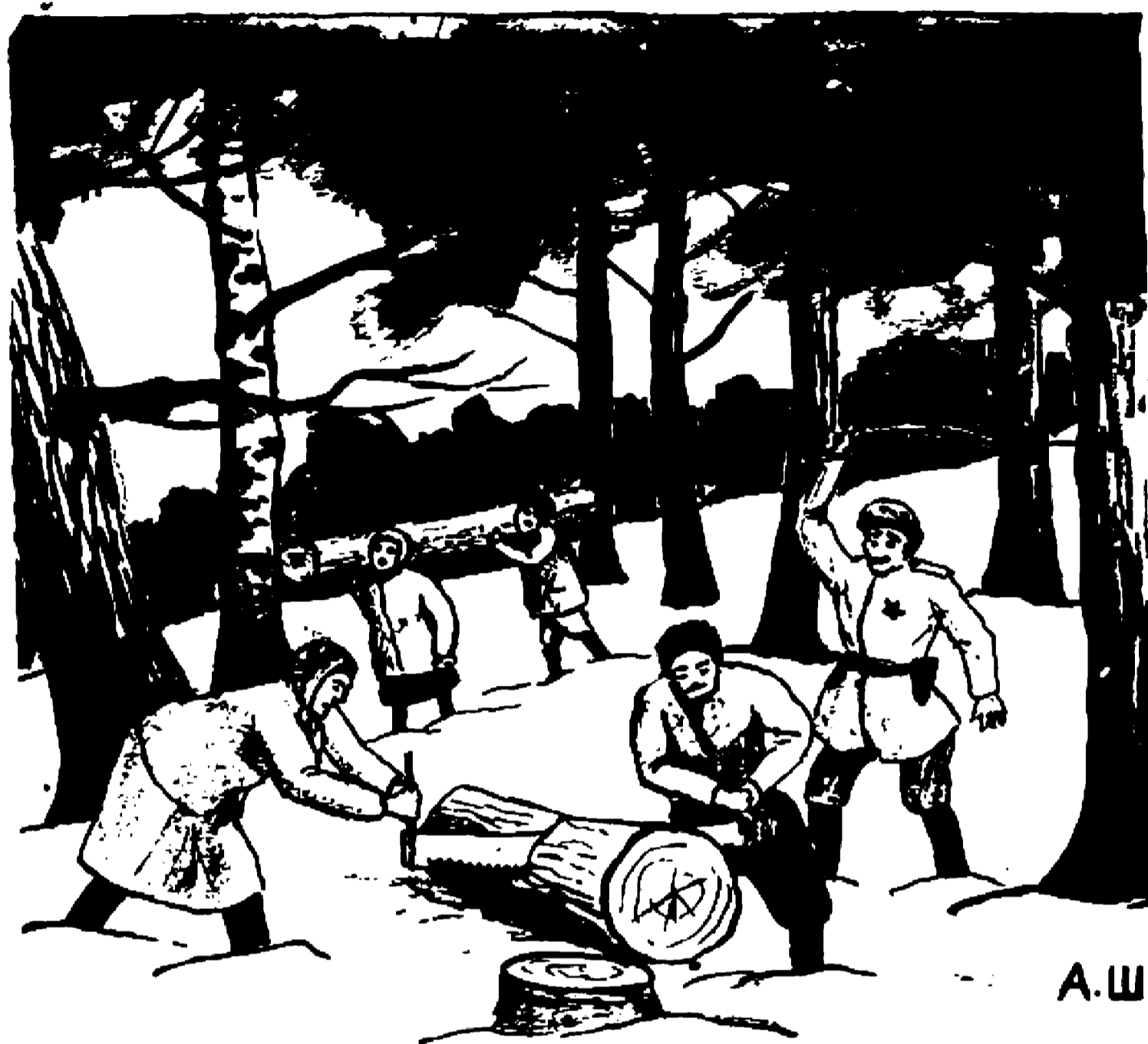
“На родіне” — роботи в снігах

сальна праця. Кермує нею і виконує її переважно сам д-р Павло Дубас, секретар ЗУАДКомітету.