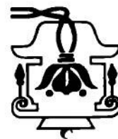
Табор скитальців в Авгсбургу подвіррю квітник-тризуб