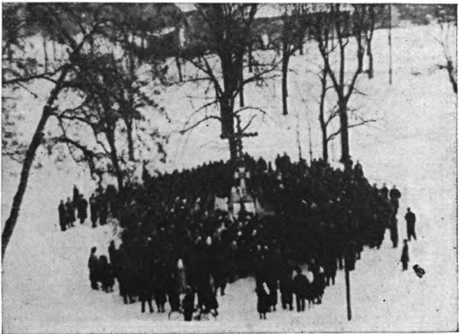
Йордан скитальців в Інгольштадті (Німеччина)

Супроти того одиноким полем, де ЗУАДКомітет може нести свою допомогу, є краї західної Європи — Бельгія, Франція,