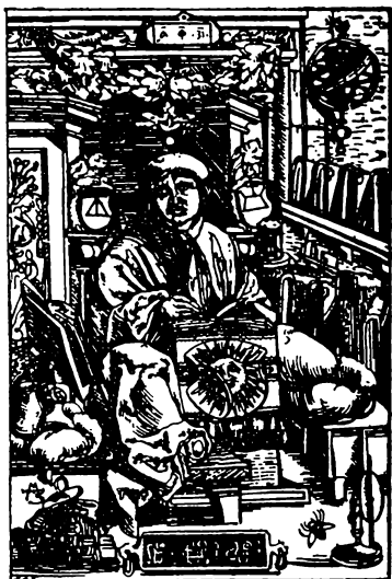
Франц Скорина, рисунок із його Біблії (1517 р.).

гові прийшло на думку вирізувати в дереві поодинокі букви, складати їх у слова та й відбивати на папері. Дуже скоро він удосконалив цей винахід а навіть збудував друкарню, в якій можна було друкувати книжки, скоро, легко й багато. Такі друкарні скоро розійшлись по всій Європі.