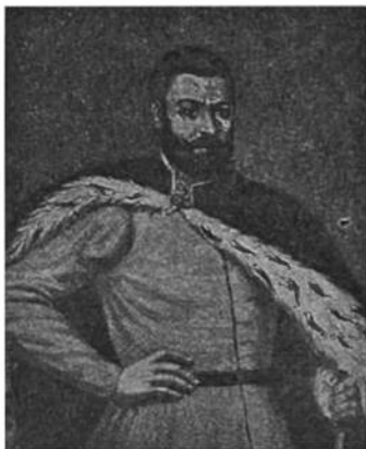
Гр. Ходкевич — литовський гетьман.

Псалтирю й Тріодь. З початком 16 ст. українські книжки друкував у Празі Франц Скорина, що вже не лиш передруковував церковні книги, але й видавав такі, що мають служити „людем посполітим к доброму наученію”; мова цих книжок була зближена трохи до живої народ-