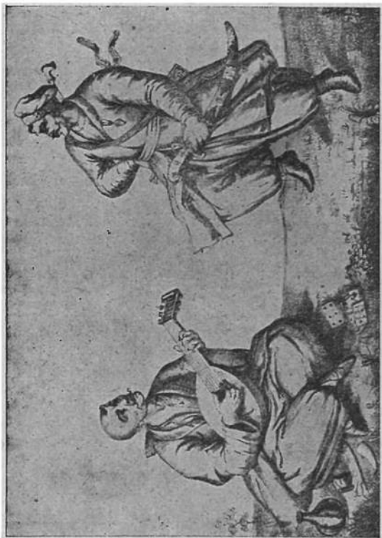
Запорожець — співак-бандурист.

в давнину. От у одній пісні говориться про козаків, що побили в якійсь битві поляків. Поляки почали називати козаків своїми