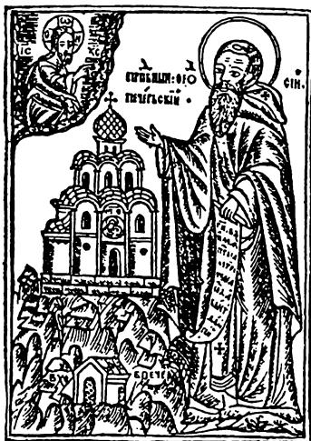
Св. Теодосій Печерський (старий рисунок).

й зрозуміло для простого народу. І треба признати, що твори цих письменників більше відповідали нашим предкам, бо вміли промовити до їх серця й не вимагали вищої освіти. А відомо, що простий нарід у ті часи не міг ще мати високої освіти, бо це були тільки початки нашої державности. Освіта в Україні почала розвиватись щопісля пізніше, а зразу вона була ще досить