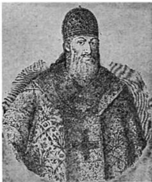
Митрополит Петро Могила.

і Київ. Особливо Київ, що прийшов на зміну Острогові, коли острозьке братство почало занепадати, розгорнув дуже широку культурно-освітню діяльність під проводом Єлисея Плетенецького, архимандрита Печерського монастиря, що був саме отим осередком культури й освіти в XVII. ст. В Печерському монастирі гуртувались тодішні українські вчені й письменники так, що цей монастир став свого рода бого-