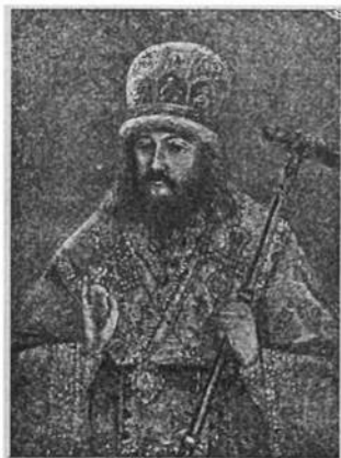
Митрополит Дмитро Туптало-Ростовський.

вже до душевних переживань дієвих осіб та намагається оті переживання виказати в драмі. А до того, драми цього автора ближчі до дійсного життя, як драми його попередників, в них уже виступають особи так чи інакше звязані з українським життям, нпр. пастухи, що дуть до народженого Христа, нагадують українських чабанів. Часом стрічаємо на-