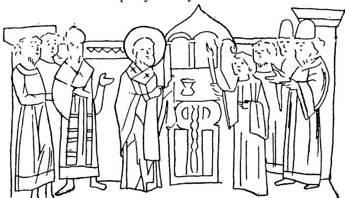
Іларіон, перший митрополит-українець (старий рисунок).

Так хотів український народ і українські князі. Це було 1051 р. І от оцей митрополит Іларіон був письменником. Він написав цікавий твір п. н. «Слово о законі й благодаті», в якому порівнює Старий Завіт із Новим. Але для нас цікавіше що інше. Оце «Слово» має закінчення, в якому говориться про князя Володимира Великого. Воно має навіть окрему назву — «Похвала кня-