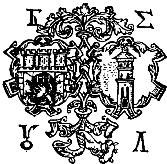
Герб львівського братства.

Коли український народ не мав уже ніякої надії на своїх вельмож, поміч прийшла з іншого боку. Свідоміше міщанство почало помалу організувати свої сили для підтриму українського національного й культурного руху. Українські міщани почали використовувати для цієї праці церковні братства. Це були релігійні товариств-