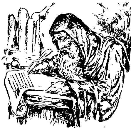
Літописець Нестор (із давнього рисунку).

Це не для себе вони робили. Для нас. Вони знали, що нарід, який не знатиме свого минулого, не матиме корення в минулім. Нарід, що не знає нічого про себе — це ніякий нарід. Бо й справді, скажіть самі, що варта сьогодні такий українець і чи він взагалі українець, який не знає своєї історії, історії свого народу, історії України. Варта він щось? Ні, нічогісько. Це темна та й