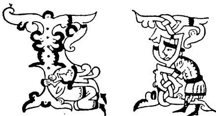
Початкові букви з рукописів княжої доби.

Але як прийшло в Україну християнство, разом із ним прийшло також письмо. Це письмо мали наші недалекі сусіди болгари. А в них це письмо зявилося вже яких сто років скорше, як прийшло до нас. Оце були собі два брати греки — Кирило й Методій, що дуже любили словян. Вони й придумали для своїх сусідів болгарів письмо — і переклали на болгарську мову