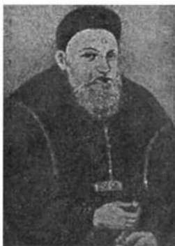
Князь Константин Острозький.

Та не довго тішився український нарід опікою своїх панів. Коли не стало цих покровителів і меценатів української культу-