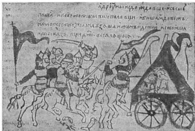
Похід Ігоря на половців (старинний рисунок).

їнських князів під проводом новгородсі- верського князя Ігоря Святославича на половців 1185 року. А написана вона два роки пізніше, тобто 1187 року... Ніюдин словянський нарід не мав до того часу та- кого величавого й гарного твору. Тому не дивно, що, як учені віднайшли цей твір та й видрукували, нашим сусідам було ду- же заздрісно, що це не їхній твір, але наш, український. Тоді московські вчені почали показувати що це твір не є правдивий, але