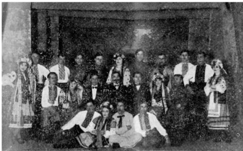
Українське Товариство Театрального Мистецтва в місті Оден-ле-Тіш у Франції.