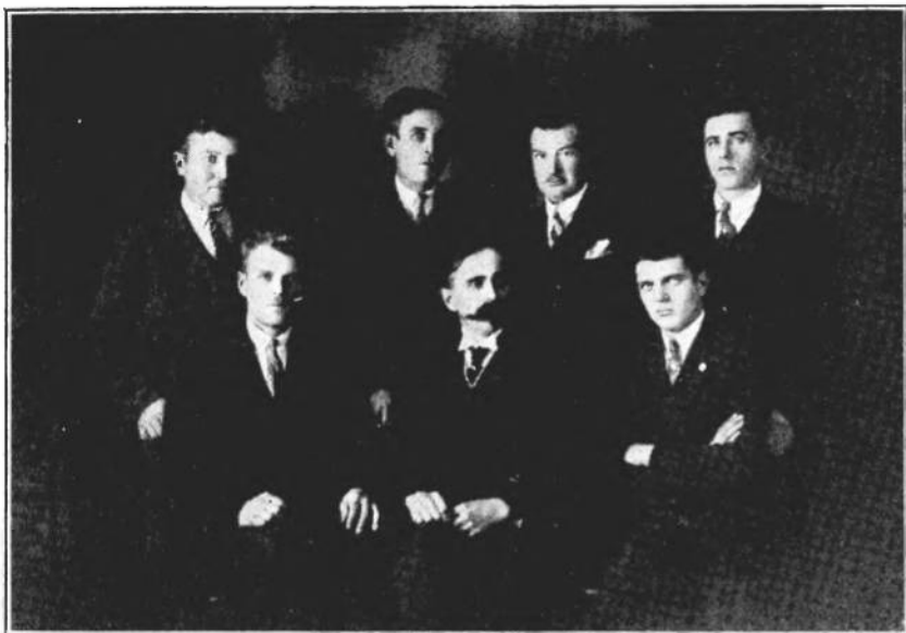
Управа Української Громади в Пловдиві (Болгарія)

биванню канцелярських порогів, українська організація в Пловдиві офіційно була зареєстрована болгарським урядом.