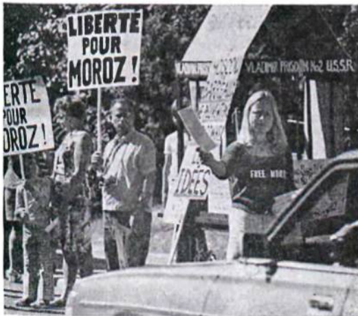
Групи демонстрантів в обороні Валентина Мороза перед совєтською амбасадєю в Оттаві біля місяця, де перебували учасники голодівки.

Акції в обороні Валентина Мороза та других репресованих українських патріотів ведуться теж в Австралії та Аргентині. Неданню Комітет Оборони Валентина Мороза в Австралії вислав протестаційні телеграми до Амбасад СССР в столиці Австралії, Кенбері, до представництва УССР в Нью-Йорку, як теж до Леоніда Брежнєва, Алєксея Косігіна та Володимира Щербицького, і до австралійського прем'єр-міністра Вітлема. В Аргентині відбулося пікетування українською молоддю виставки совєтського промислу, яка відбувалася в Буєнос Аїрес від 4-го до 15-го вересня ц. р. Демонстранти роздавали відвідувачам летючки в єспанській мові, в яких домагалися звільнення Валентина Мороза та інших українських діячів в СССР.