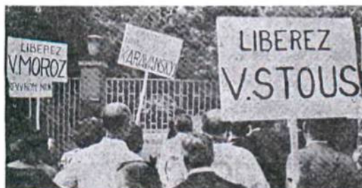
Демонстрація в Бельгії 16 квітня 1974 р. Українці перед совєтською амбасадю в Брюсселі вимагають звільнення українських політичних в'язнів.