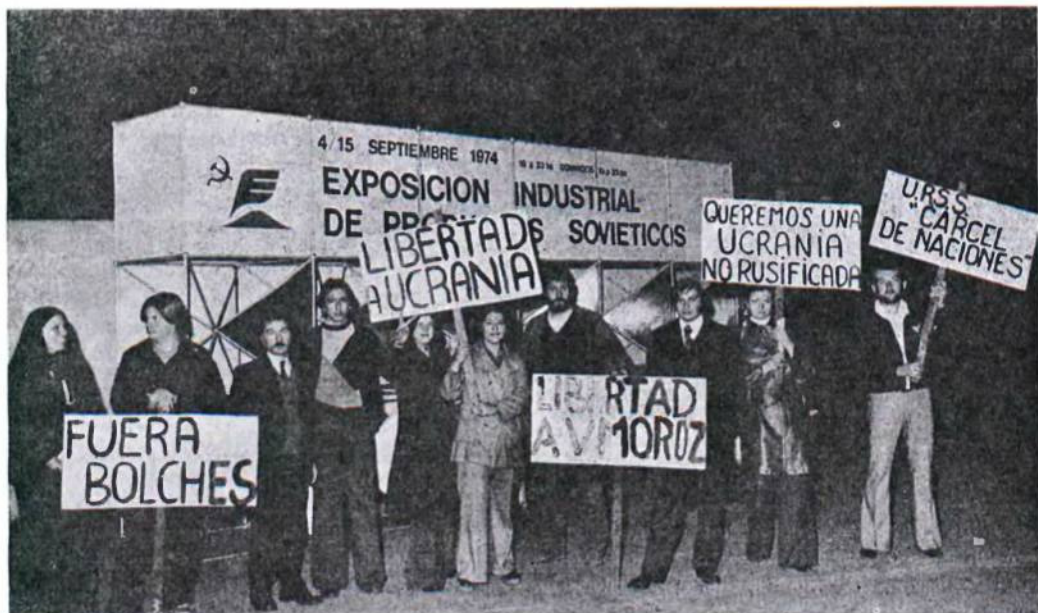
Демонстрація української молоді перед совєтським павільйоном в Буенос Аїрес, Аргентина.

У травні цього року створено в Нью Йорку Комітет Українських Жінок для Оборони Валентина Мороза й інших українських діячів, ув'язнених у тюрмах і концентраційних таборах в ССРСР. Він влаштував при кінці липня першу голодівку перед Об'єднаними Націями. Друга голодівка солідарності з В. Морозом почалася 25 вересня і тривала до 29 вересня, щоб того ж дня включитися в маніфестаційний похід по П'ятій есенно. Голодуючі українки, одягнені в кацетні пакидки із в'язничими нумерами, звертали на себе увагу учасників-делегатів.