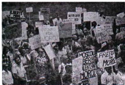
Фрагмент з демонстрації в Оттаві в обороні Валентина Мороза, серпень 1974 р.

Члени Секретаріату СКВУ повинні зголосити свою участь у Пленарній Сесії не пізніше 1-го грудня 1974 р., висилаючи до бюро Президії в Торонті наперед розіслану анкету.