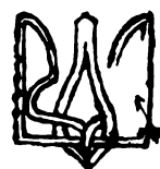
Plattenfehler 2, 20. Marke.