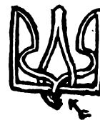
Plattenfehler 6, 91. Marke.