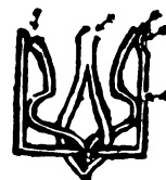
Plattenfehler 3, 80. Marke.