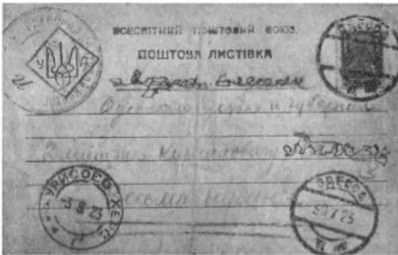
Abb. 1. Postkarte des Postbezirkes Odessa.

Postbezirkes in dem entsprechenden Rechteck noch die Worte „Platz für die Marke“ stehen. Bei der von der Postdirektion Kiew herausgegebenen Postkarte (Abb. 2)