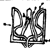
Plattenfehler 4, 81. Marke.