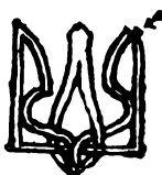
Plattenfehler 5, 90. Marke.