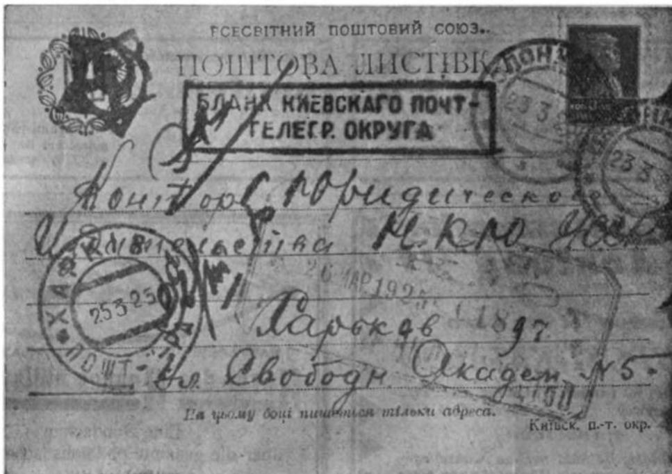
Abb. 2. Postkarte des Postbezirkes Kiew.

Postbezirkes in dem entsprechenden Rechteck noch die Worte „Platz für die Marke“ stehen. Bei der von der Postdirektion Kiew herausgegebenen Postkarte (Abb. 2)