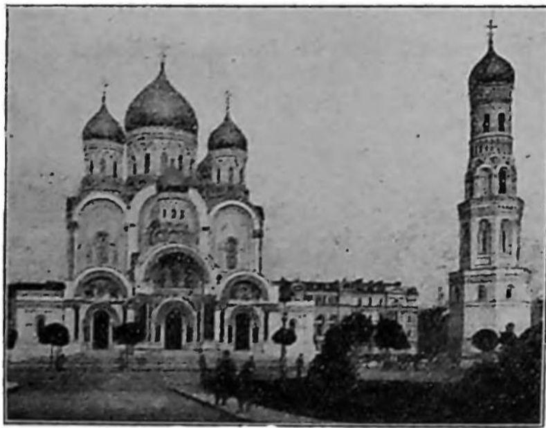
Варшавський православний собор.

Варшавський православний собор. Будівля собору була розпочата в перших роках ц. століття на найкращій і найбільшій у Варшаві Саксонській площі. На будівлю царський уряд асигнував 3 мільйони рублів, але, як свідчать церковні літописи, не мало грошей було зібрано й з українського населення шляхом жертв у церквах. Собор збудовано в яскраво