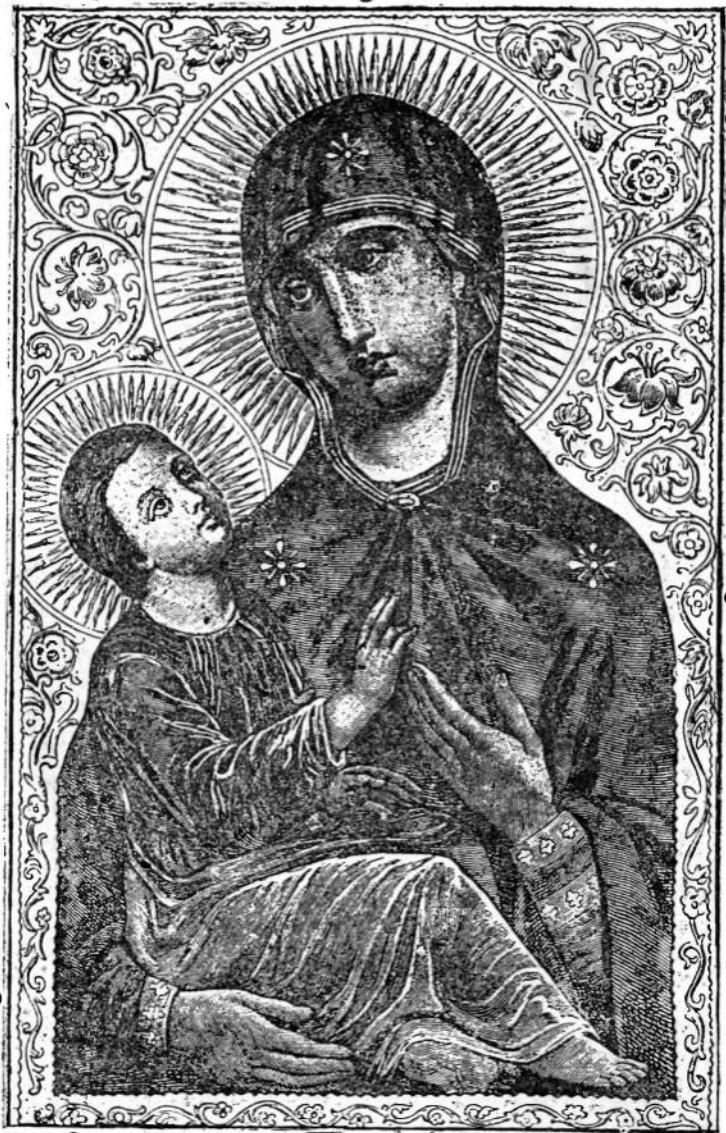
Чудотворний образ Холмської Божої Матері.