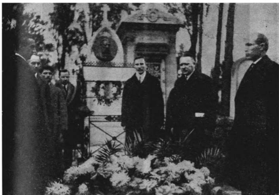
Учасники I-го Військового З'їзду на могилі С. Петлюри.

На стіні бараку висить великий план майбутнього хутору праці ген. Удовиченка.