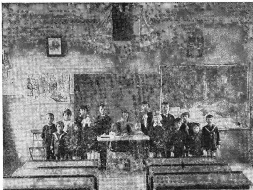
Українська дитяча школа ім. Т. Шевченка в Гіютангї.

обом сторонам і запропонувавши їм ліквідувати цілий конфлікт мирними способами.