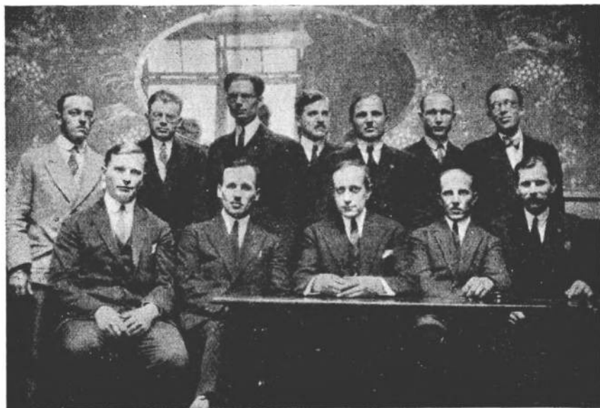
Група учасників 6-го з'їзду Союзу Укр. Емігр. Організації у Франції.

до Німеччини. Угорщини до часу до пори боялися, бо не пригасли буйні пристрасті цього народу, не виходячи його агресивний гін.