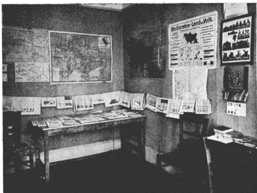
Читальня Бібліотеки ім. С. Петлюри в Парижі.

На з'їзд поступили привітання від п. Є. Бачинського, редакції «Тризуба» та Ради бібліотеки ім. С. Петлюри.