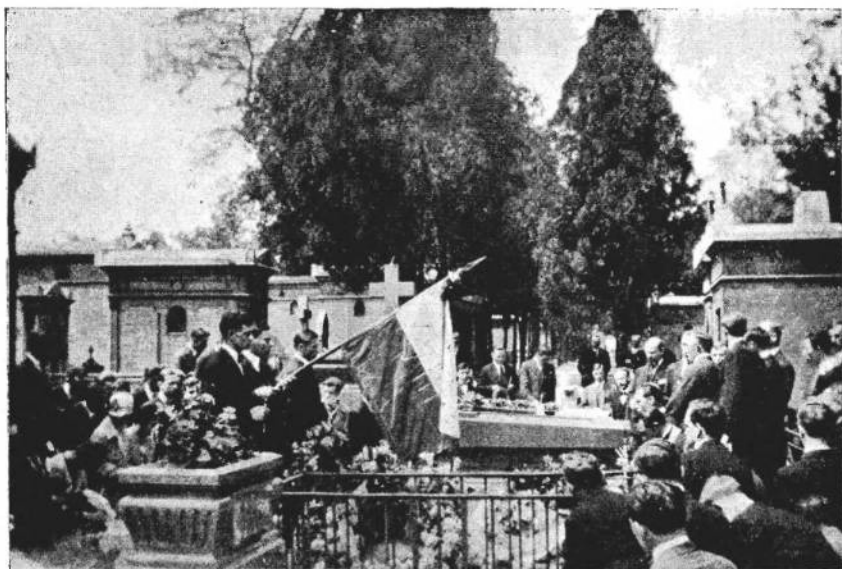
Манахида на могилі св. пам. С. Петлюри в Парижі, 26 травня 1929 р. в 3-ю річницю його смерті.

українські ж «товариші» думають инакше і Шліхтер свій виступ так пояснює: