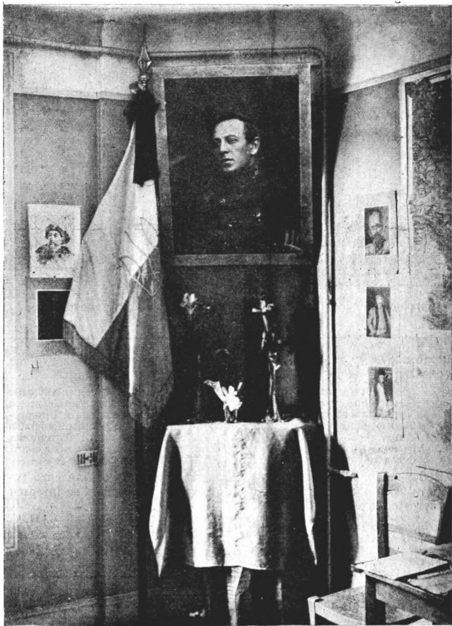
Портрет С. Петлюри у Бібліотечі його імені в Парижі.