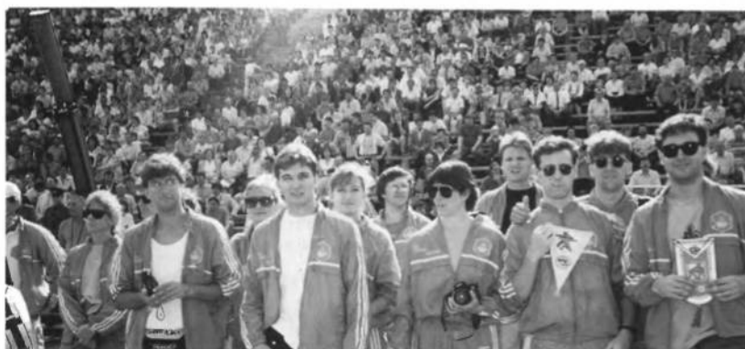
Фрагменти із святкового відкриття зустрічі збірних дружин і членів Проводу УСЦАК на стадіоні "Україна" у Львові, що відбулося 22 червня 1991 року.