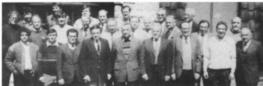
Делегати Українських спортивних осередків ЗСА на Загальних Зборах Української Спортової Централі Америки і Канади, що відбулися 22-го квітня 1989 року в приміщеннях "Союзівки".