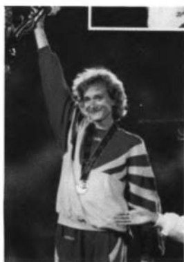
Золота медалістка в легкій атлетиці — Інесса КРАВЕЦЬ.