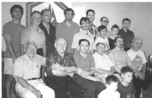
Учасники шахових першенств УСЦАК — 1994 року, господарем яких в цьому Ювілейному році були УСВТ "Ч. Січ".