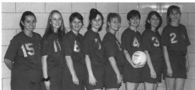
Жіноча дружина УСВТ "Ч. Січ", першунки відбиванки УСЦАК в 1991, 1993, 1994 роках і віце-чемпіонки в 1996 році.