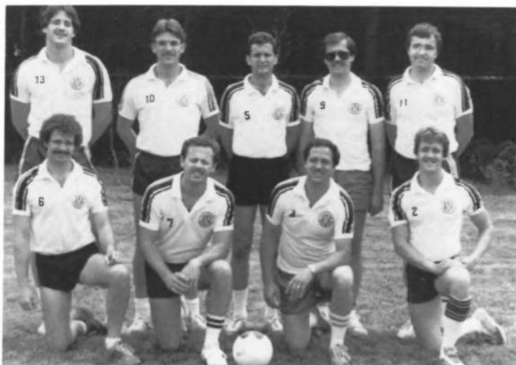
УСО "Тризуб" Філадельфія, віце-чемпіон відбіванкових першостей УСЦАК в 1984 р.