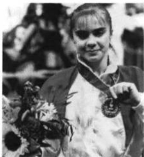
Абсолютна чемпіонка Олімпіади в Атланті в спортивній гімнастиці, яка здобула дві золоті і одну срібну медалі — Лілія ПОДКОПАСВА.