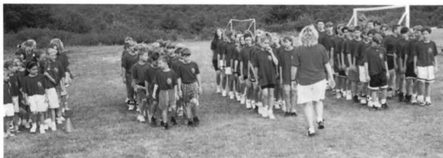
Учасники Спортових Ігрищ Молоді 1994 року в часі відкриття.