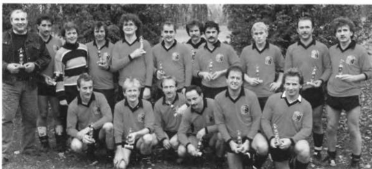
Старші і молодші футболісти СТ "Україна" Торонто на турнірі УСЦАК — Делегатури Канади, в 1990 році.