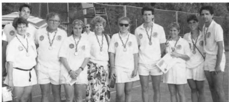
Стоїть збірна тенісу УСЦАК з виграними медалями на тенісовому корті в Івано-Франківську, Україна.