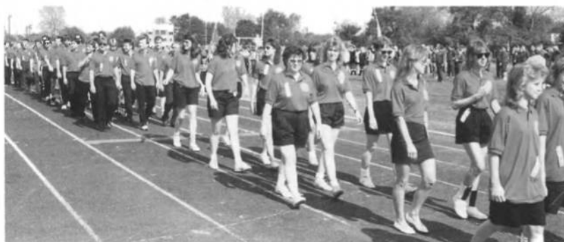
В марші до відкриття Української спортової Олімпіади у Філядельфії, репрезентанти місцевого УСО "Тризуб".