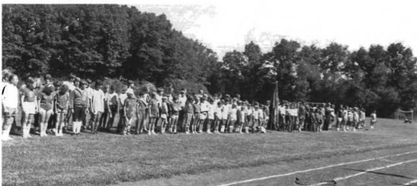
Фрагмент відкриття Українських Спортових Ігрищ Молоді в 1984 році.