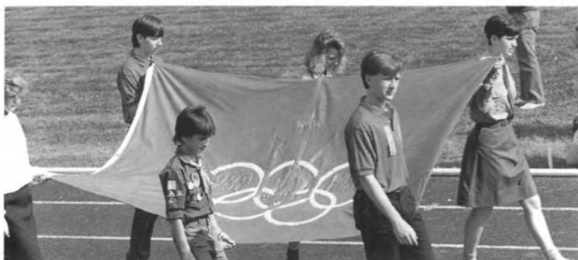
Прапор Української Спортової Олімпіади в 1988 році несуть репрезентанти спортивних осередків і молодечих організацій.