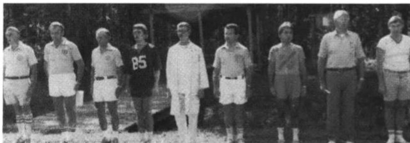
Провід Українських Спортивних Ігрищ Молоді в 1986 році.