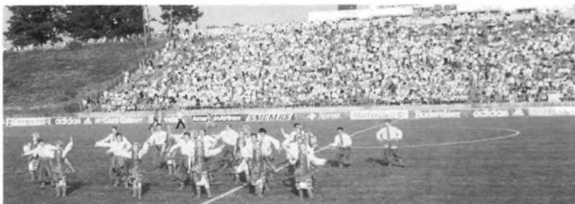
Танцювальний ансамбль СУМ Йонкерс "Чайка" розважав глядачів на стадіоні в Піскатавей, Н.Дж. перед змаганнями футбольних репрезентацій ЗСА і України, що їх спів-спонзором був УСЦАК.