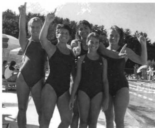
Частина дружини УСВТ "Ч. Січі", що здобула першенство в плавацьких змаганнях на Ігрищах молоді в 1985 році.