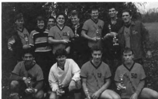
СТ "Україна" Оттава, Канада, учасники футбольного турніру УСЦАК — Делегатури Канади в 1990 році.