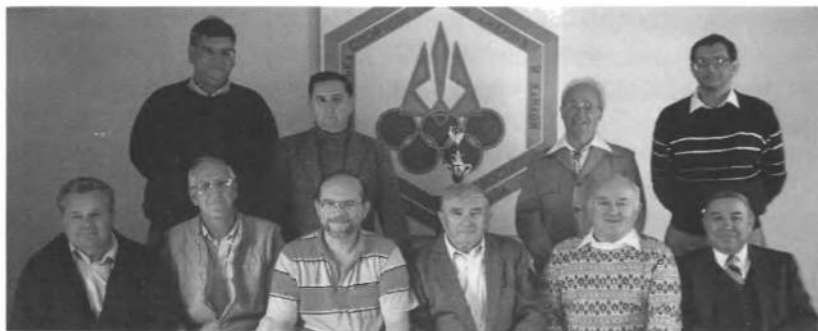
Частина учасників шахових першенств УСЦАК на оселі "Верховина" в Глен Спей в 1991 році.