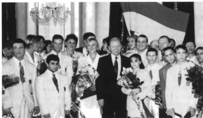
Президент України Леонід Кучма в часі прийняття в Маріїнській палаті в Києві 8-го серпня 1996 року. Усі медалісти України були нагороджені Державними преміями.