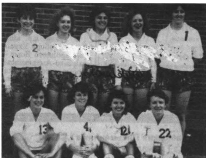
УАСТ "Львів" Клівленд, першунки відбиванки УСЦАК в 1983, 1984, 1985, 1987 і 1988 роках.