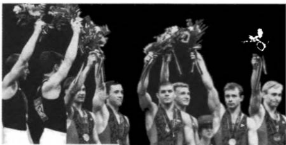
Чоловіча збірна спортової гімнастики Україна здобула дружинову бронзову медалю.