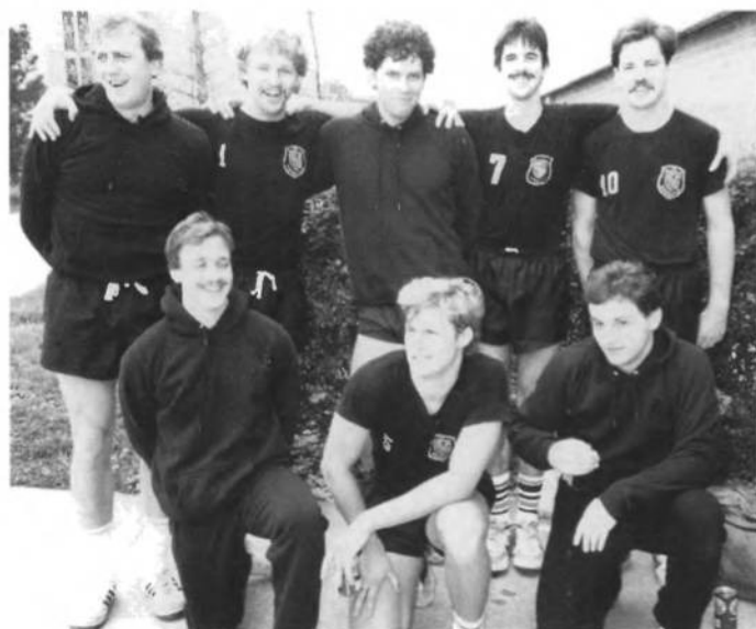
УСВТ "Ч. Січ" першун відбиванкових першостей УСЦАК в Ньюарку в 1987 році.