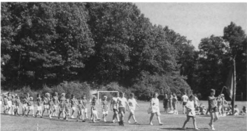
Фрагмент відкриття Українських Спортових Ігрищ Молоді в 1987 році.