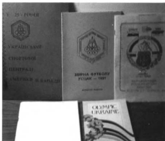
Книжечки і брошури, що вийшли з друку завдяки УСЦАК.