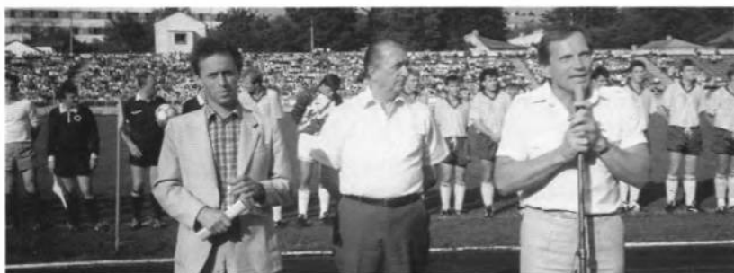
Делегацію УСЦАК перед футбольними змаганнями збірної УСЦАК з ФК "Карпати" на стадіоні "Україна" у Львові, вітає депутат ВР України — Я. Кендзьор. Посередині стоїть голова УСЦАК — М. Стебельський.