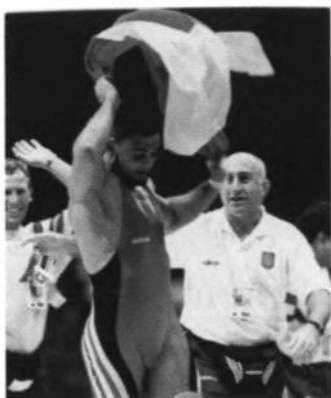
Золоту медалю в клясичній боротьбі в Атланти здобув Вячеслав ОЛЕЙНИК.