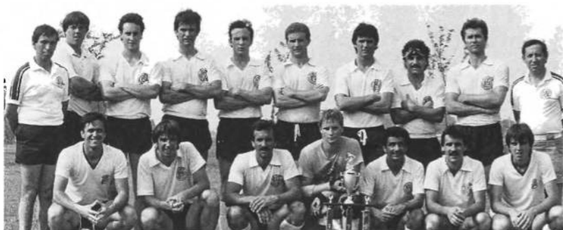
Перша футбольна дружина УСО "Тризуб" чемпіон Пенс. Ліги, віце-чемпіон турніру Українського Фестивалю під патронатом УСЦАК в 1981 році.