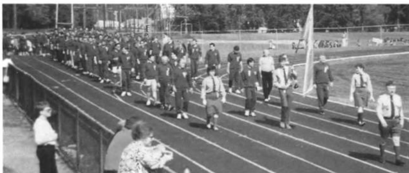
Збірна Спілки Української Молоді, учасники Української Спортової Олімпіади у Філядельфії.