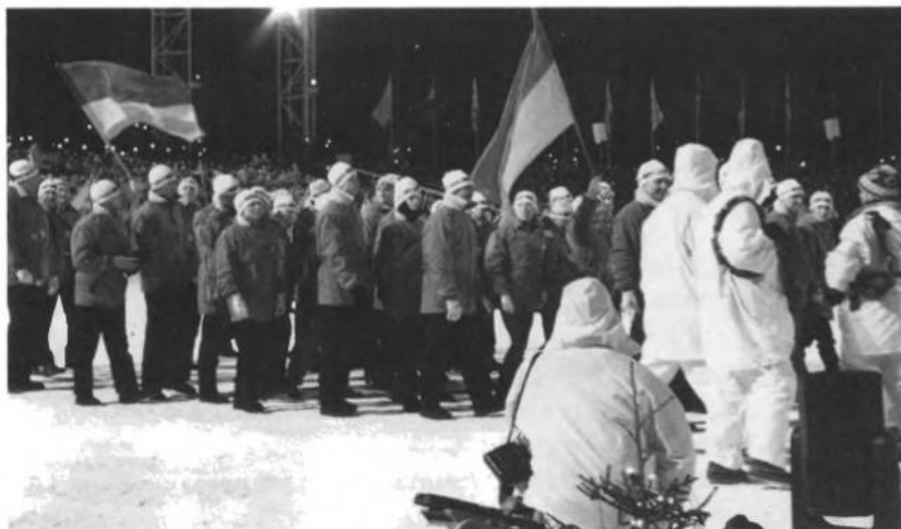
Збірна України в Ліллегаммері, Норвегія на зимовій Олімпіаді в 1994 році.

На жаль з бігом кількох років після Олімпіади особливо по переїзді Баюл до ЗСА, обставини для неї змінилися, вона раптово розбагатіла, але рівночасно втратила чолову позицію в цьому спорті. Не включилася Баюл в ряди української громади в ЗСА і забула за щиросердечну піддержку УСЦАК, коли в неї була найбільша потреба. Старе добро забувається!