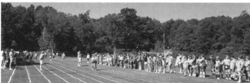
Фрагмент відкриття Українських Спортових Ігрищ Молоді в 1985 році.