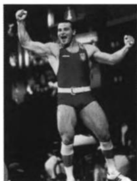
Золотий медаліст у важкій атлетиці — Тімур ТАЙМАЗОВ.