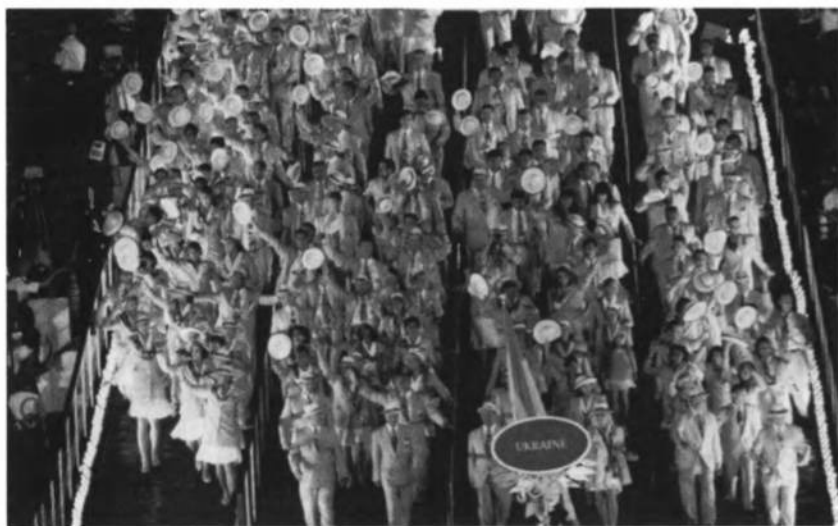
Олімпійська збірна України входить на головний стадіон в Атланти.