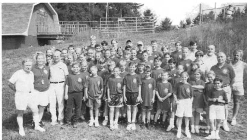
Група учасників легко-атлетичних змагань на спортивних Ігрищах молоді в Глен Спей, Н.Й. в 1994 році.