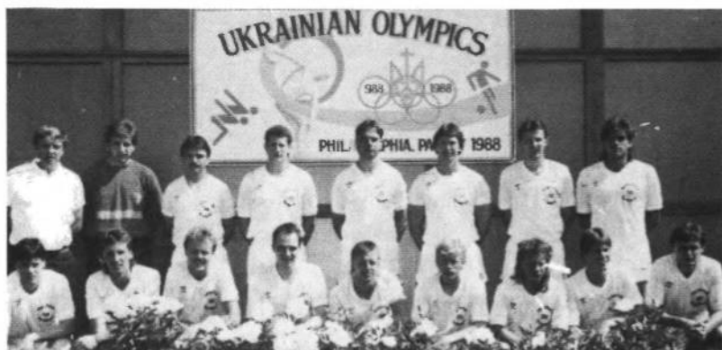
УСВТ "Чорноморська Січ" Ньюарк, чемпіони футболу Української Спортової Олімпіади — 1988 року.