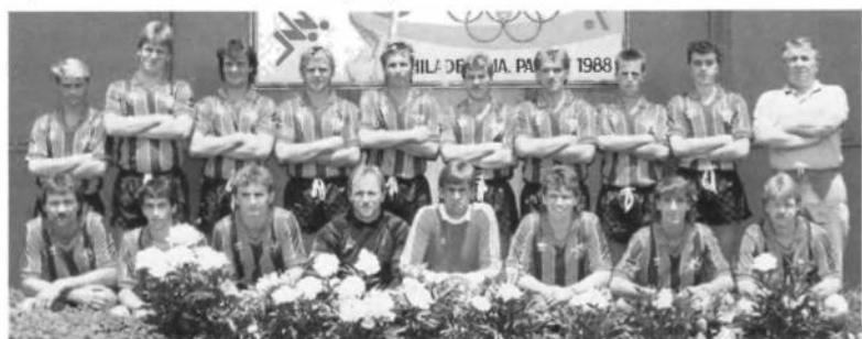
СК СУМ "Крила" Чикаго, віце-чемпіони Української Спортової Олімпіади — 1988 року.