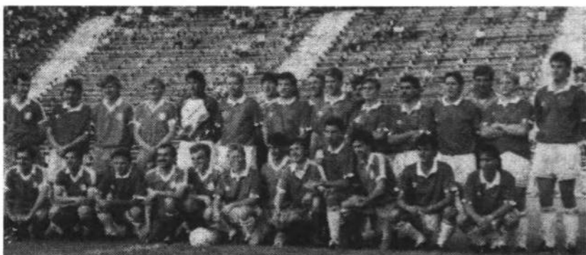
Футбольна збірна УСЦАК і дружина ФК "Карпати" Львів на стадіоні "Україна" у Львові перед товариськими змаганнями.