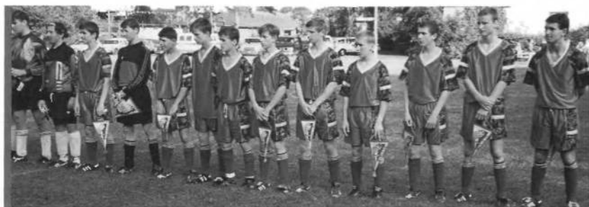
Юні футболісти клубу "Жупан" з м. Винник, Україна перед товариськими змаганнями під патронатом УСЦАК з юнаками "Ч. Січі" (фото-знімка винзу) 1 червня 1995 року.