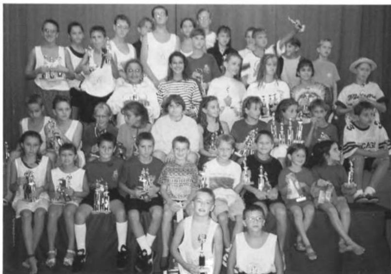
Учасники плавацьких першостей УСЦАК в 1993 році.