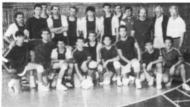
Збірна УСЦАК (в темних сорочках) і команда відбиванки Інституту Фізкультури — Львів.