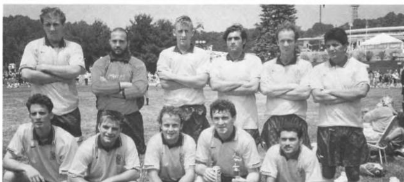
"Ч. Січ" — першун футбольного турніру Українського Фестивалю під патронатом УСЦАК в Н.Дж, в 1995 році.