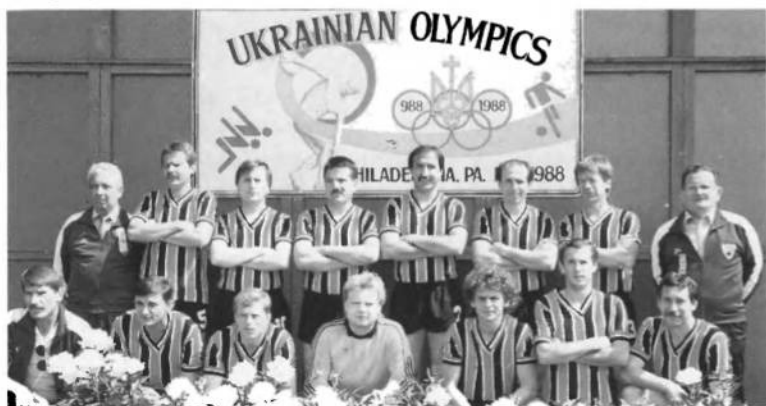
УСК Нью Йорк, що здобув бронзові медалі на Українській Спортовій Олімпіаді — 1988 року.