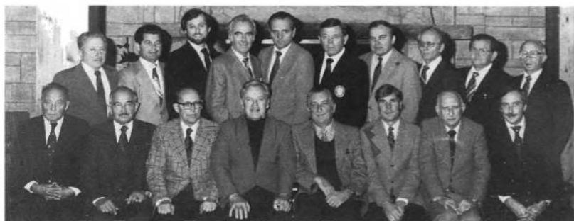
Учасники Загальних Зборів УСЦАК на Союзівці в 1984 році.