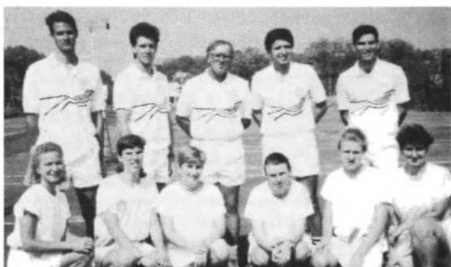
Тенісова збірна УСЦАК, що взяла участь в турне в Україні.