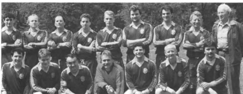
СК СУМ "Крилаті" Йонкерс, віце-чемпіон "Інтернаціонального" футбольного турніру під патронатом УСЦАК на "Верховині" в Глен Спей в 1995 році.