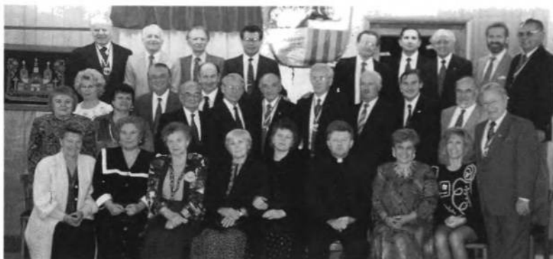
Учасники і гості Ювілейних Загальних Зборів УСЦАК, що відбулися в суботу 8-го жовтня 1994.