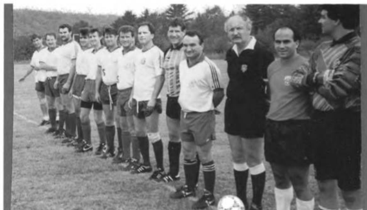
Футбольна дружина СК СУМ "Крилаті", що в турнірі Українського Фестивалю в 1993 році здобула бронзову нагороду.