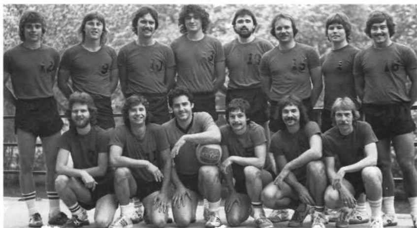
УАСТ "Леви" Чикаго, першуні відбиванкового турніру УСЦАК в Мейплвуді в 1984 р.