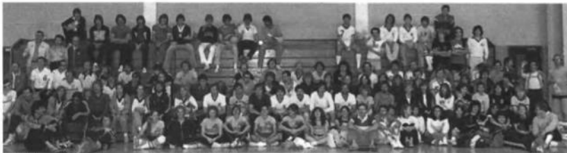
Відбиванкові першості УСЦАК, що відбулися в суботу 27-го квітня 1992 р. в Мейплвуді, Н.Дж.