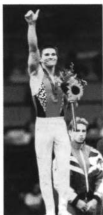
Золотий медаліст в спортивій гімнастиці — Рустам ШАРІПОВ.