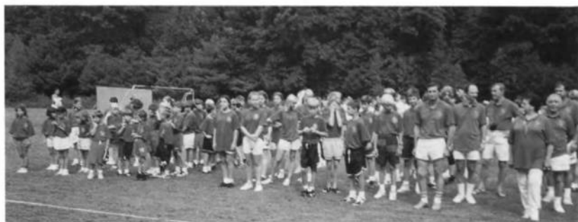
Частина учасників в Українських Спортових Ігрищах Молоді в Еленвіл в 1995 р.