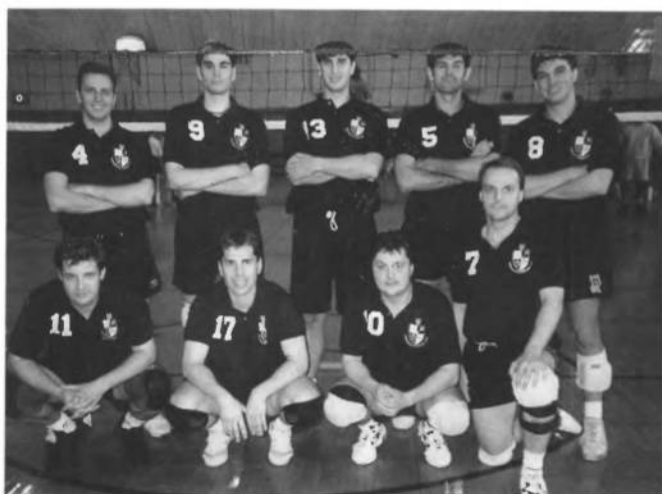
І-ша чоловіча відбіванкова дружина "Ч. Січі", першун УСЦАК в 1996 році.