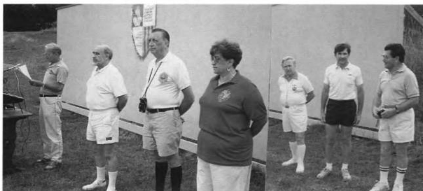
Провід Українських Спортивних Ігрищ Молоді на оселі "Верховина" в 1994 році.