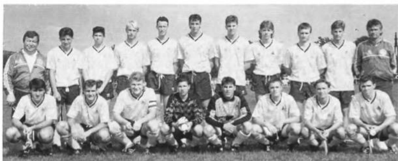
Збірна юнаків футболу УСЦАК, що відбула турне в Західну Україну в 1991 року.