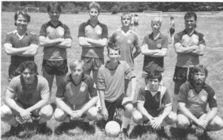
Футбольна дружина УСТ "Черник" Дітройт на Ювілейному турнірі УСВТ "Ч. Січ" на "Верховині", що пройшов під патронатом УСЦАК.