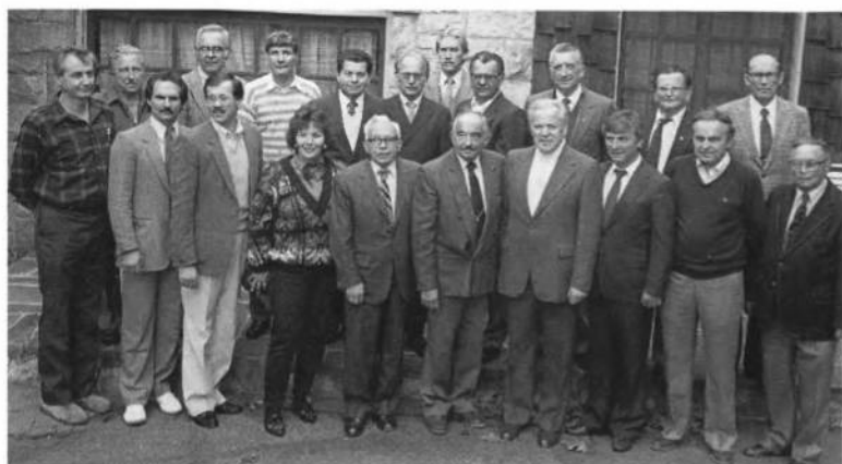
Учасники Загальних Зборів УСЦАК, що відбулися в суботу 1-го листопада 1986 року на Союзівці.