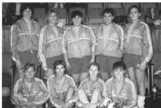
Жіноча відбиванка збірна УСЦАК на відбиванковому корті у Львові в часі турне по Західній Україні в 1991 році.