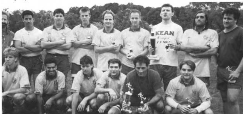
Футбольна дружина УСВТ "Ч. Січ" першун турніру Українського Фестивалю — 1987 року в Артс Центрі, Голмдель, Н.Дж. під патронатом УСЦАК.