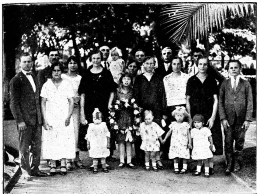
Українська Громада в Сан-Паоло (Бразилія) в річницю смерті Гол. Отамана.

«партія мусить дбати про те, щоб з'явилася українська марксистська критика, що її завданням є письменників, які зблизилися з інтернаціонально-пролетарського шляху, охороняти перед тим, щоб їх «не взяв в полон націоналізм». В совітській літературі мусить повстати союз, в якому українські письменники повинні бути міцно зв'язані з руським».