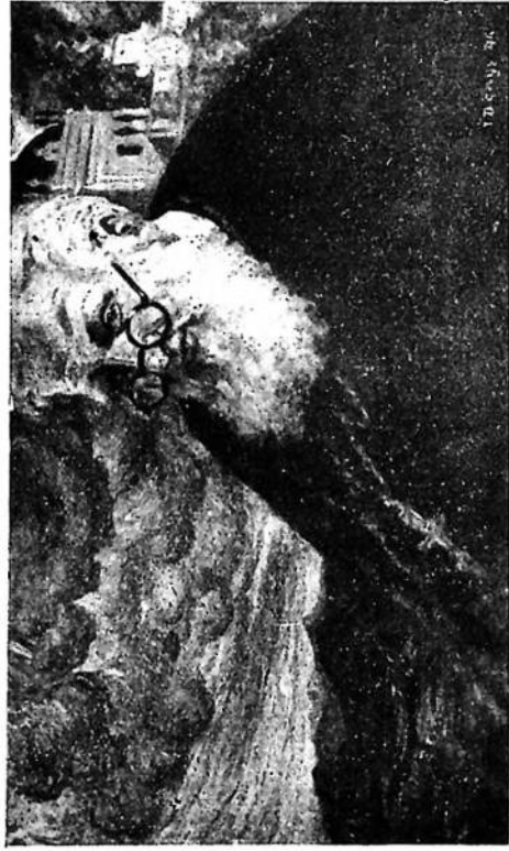
Один з останніх портретів Митрополита. (Малював І. Денис).