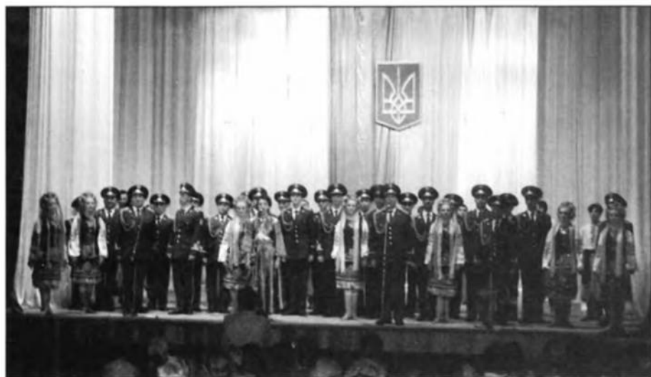
Ансамбль Прикарпатського Військового Округу.

На закінчення П. Вівчар сказав: „Наша емблема – меч, перекований на рало, і різні ворогуючі сторони подали одна одній руки“.