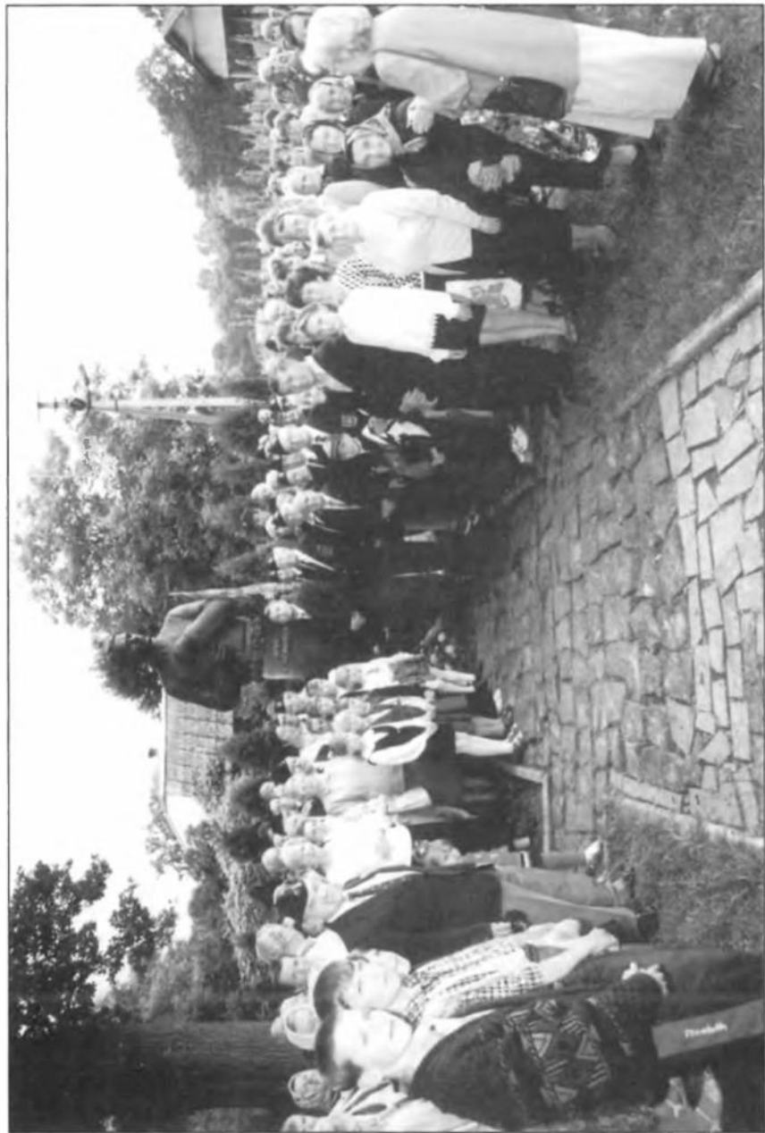
Українська група з Англії і українське громадянство біля пам'ятника полк. Євгена Коновальця в Зашкові.