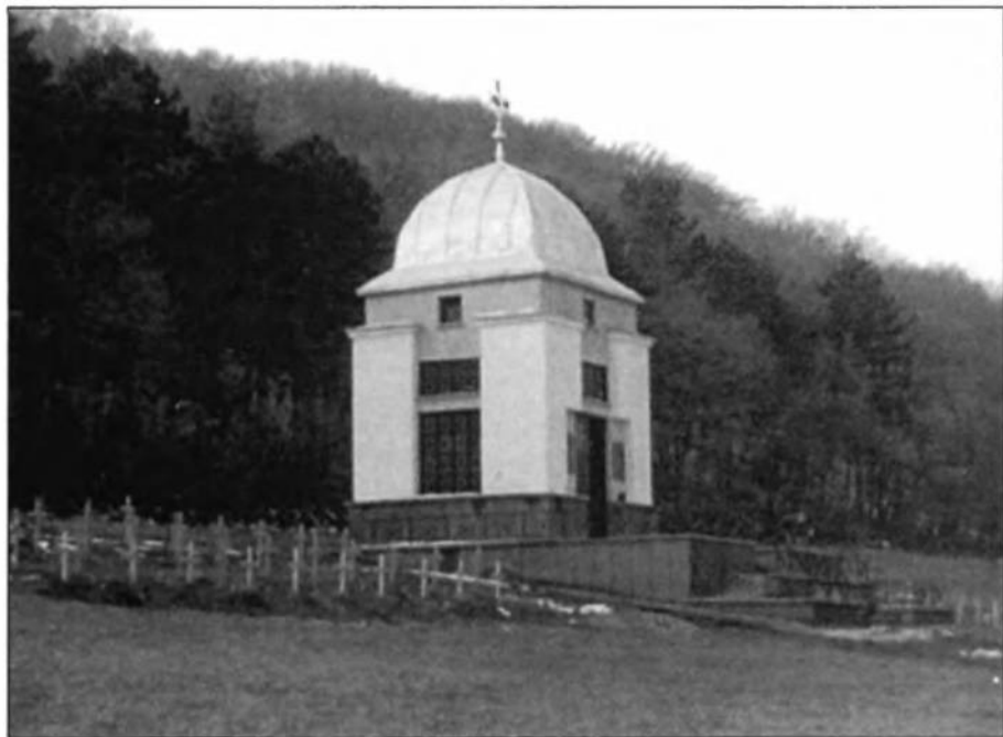
Пропам'ятна каплиця на цвинтарі-меморіалі біля с. Червоне.