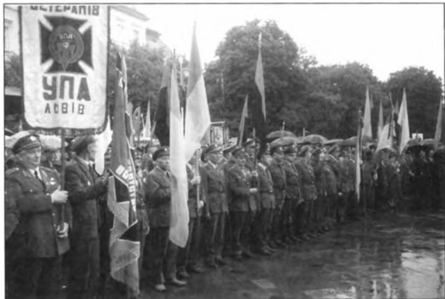
Члени Всеукраїнського Братства ОУН-УПА Львівського краю.

Бо великі, а воднораз криваві й жорстокі історичні події пройшли протягом віків на землях нашої України. Уся наша історія пронизана безперервною боротьбою за волю і незалежність нашої Матері – України. І коли не стало степових гордих конкістадорів, і наша батьківщина опинилась у неволі, козацький літописець, ламаючи руки з горя, волав: З яких причин, і через кого спустошена земля наша? На це його запитання-докір ані він, ані історики не знайшли ще й досі повної, історично об'єктивної відповіді.