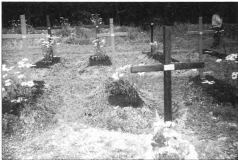
Могилки перепохоронених воїнів Дивізії «Галичина» на цвинтарі-меморіалі.