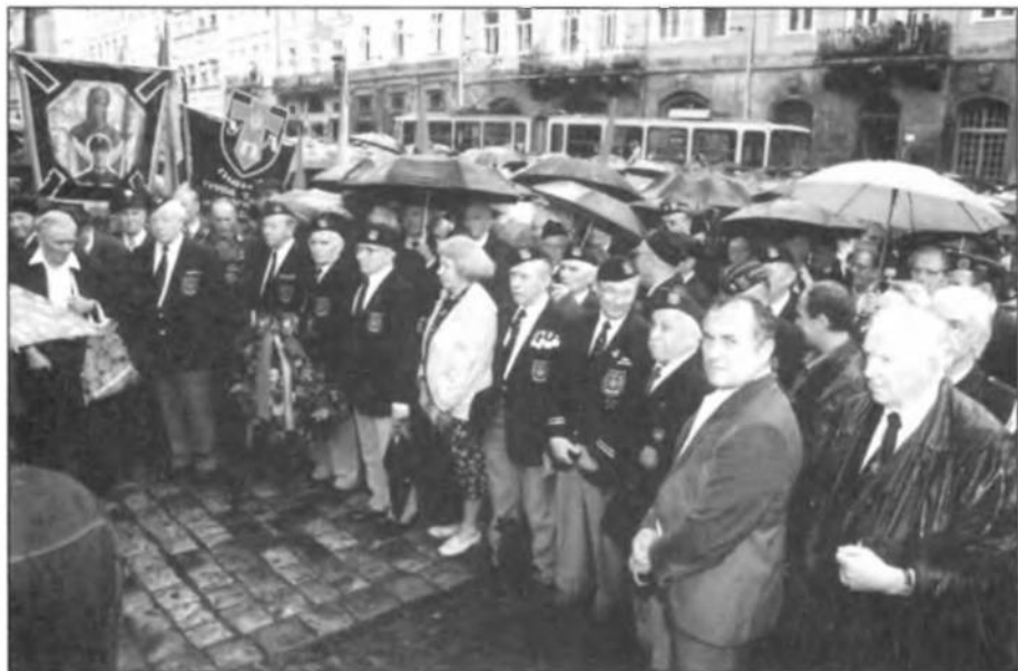
Члени ОБВУ, Братства кол. Вояків 1 УД УНА, члени Галицького Братства 1 УД УНА і громадянство на площі.

Але життя нації не зупинилось, як воно і не зупиняється сьогодні. Коли вдарили громи Першої світової війни, стрункі колони Українських Січових Стрільців «піднімали в лузі червону калину». Невмирушу легенду героїчної боротьби за волю України творили і залишили нам Армія Української Народної Республіки, Українська Галицька Армія, Корпус Січових Стрільців, Гетьманські війська, Холодноряці, молоденькі герої Крут, лицарі Базару, завзяті повстанці, котрі ще довго після закінчення Визвольних Змагань воювали з червоним наїзником, який розпинав Україну, знищуючи українську інтелігенцію і борців-патріотів. Визвольну боротьбу продовжили Українська Військова Організація й Організація Українських Націоналістів у передвоєнних роках. У тих роках згадаймо воїнів Срібної Землі Закарпаття – Карпатську Січ, а в початках німецько-радянської війни – Дружини Українських Націоналістів. У гримучих роках Другої світової війни утворилось військово-формування Дивізія «Галичина», пізніше 1 УД Української Національної Армії, а в боротьбі з коричневим і червоним окупантами зродилася Українська Повстанська Армія. Про її героїчну боротьбу у воєнних і післявоєнних роках писав Головний Командир генерал-хорунжий Роман Шухевич – Тарас Чупринка, що боротьба УПА і революційного підпілля – це найбільш героїчна боротьба в історії України.