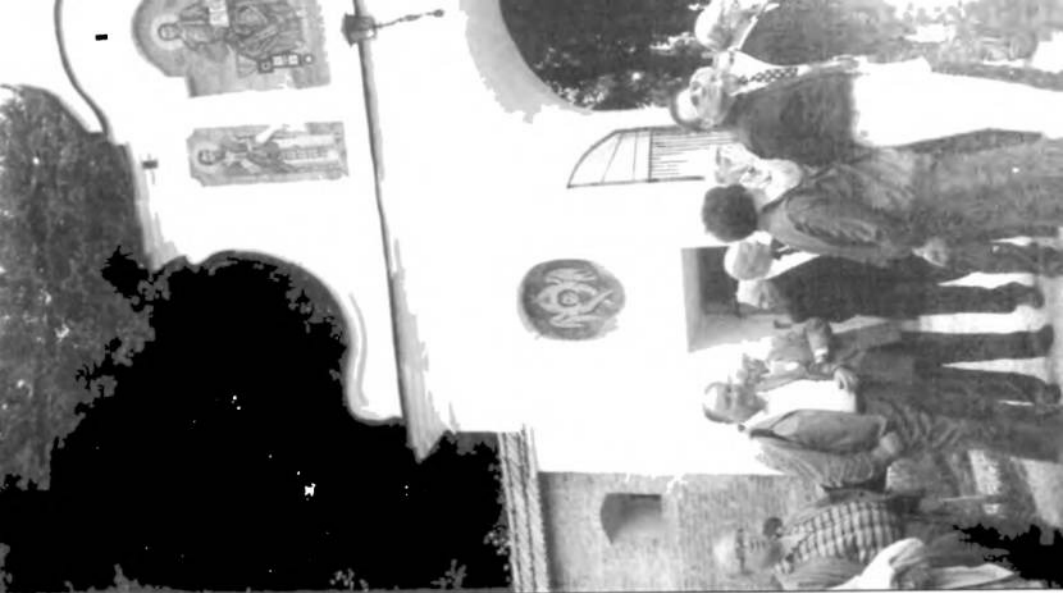
Священники служатъ Ланахиду в церкви Різдеа Христового в Жоквѣ.