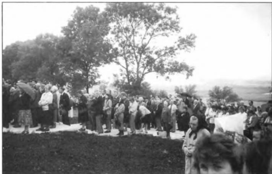
Громадянство в часі польової Служби Божої і освячення пропам'ятної каплиці на цвинтарі-меморіалі біля села Червоне на Золочівщині.

історію України як військовоє формування ХХ століття, і з історії вже ніхто її не викреслить, байдуже, як би її не характеризували. І тим ми можемо й повинні гордитися.