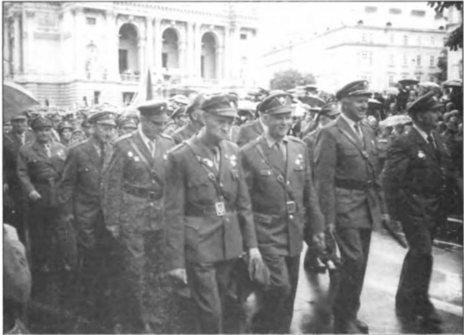
Марширує колона членів Всеукраїнського Братства ОУН-УПА.